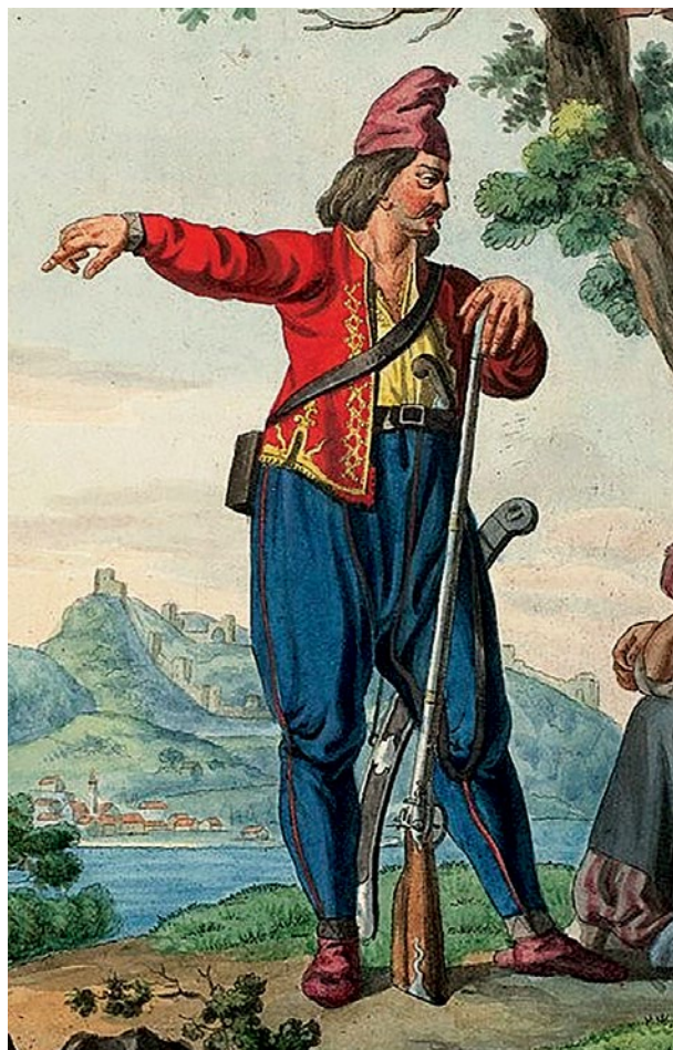
Рис. 1. Арнаути у Північному Причорномор'ї. Малюнок Є. Корєєва, опублікований в 1812–1813 рр..

Повторне формування грецького військового підрозділу в Одесі відбулося за нового царя Олександра I, на честь якого греки і перейменували своє поселення з Арнаутівки на Олександрівку (сучасне м. Чорноморськ) (Сапожников и Белоусова 80). Указ про створення Одеського піхотного грецького батальйону вийшов