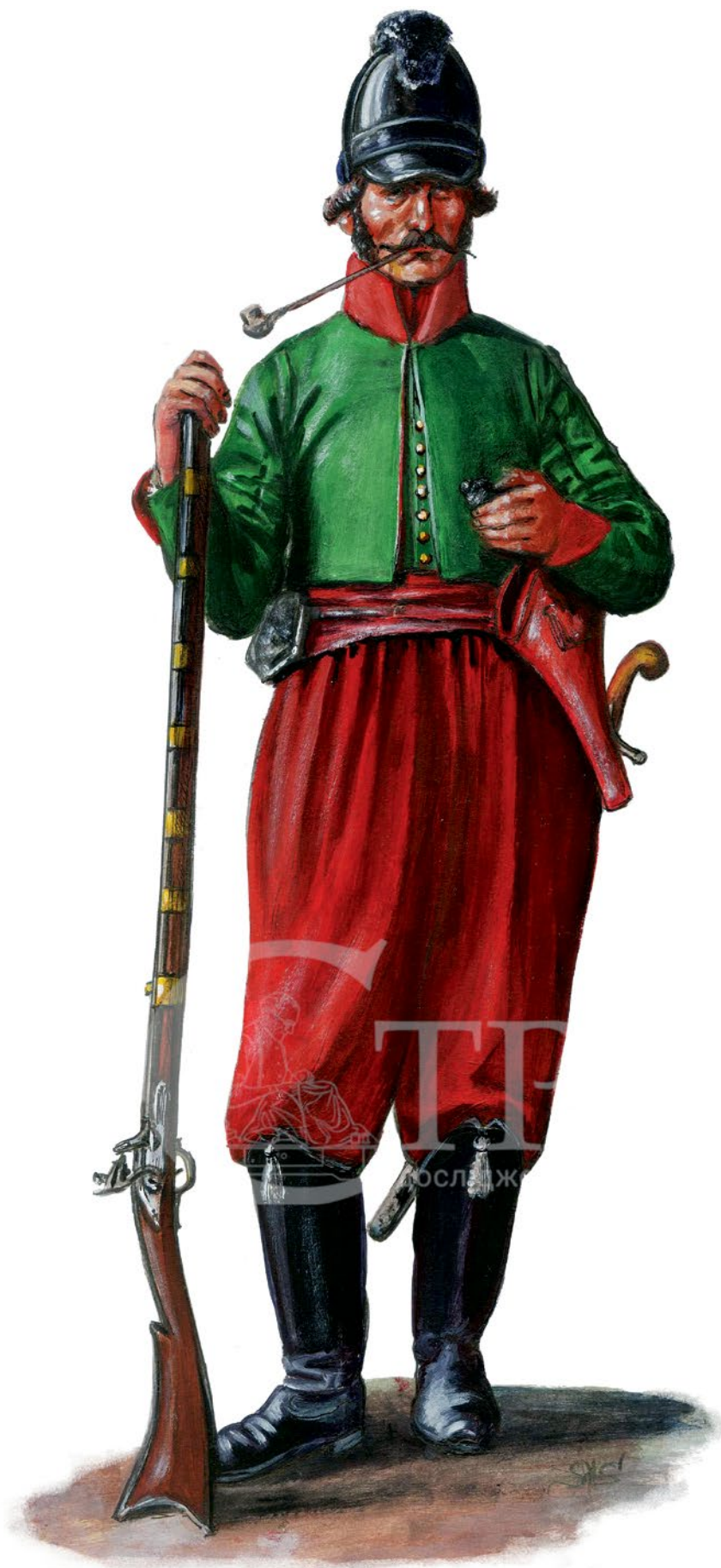
Рис. 3. Художня реконструкція рядового Одеського грецького піхотного батальйону 1804–1819 рр. (© С. Шаменков).