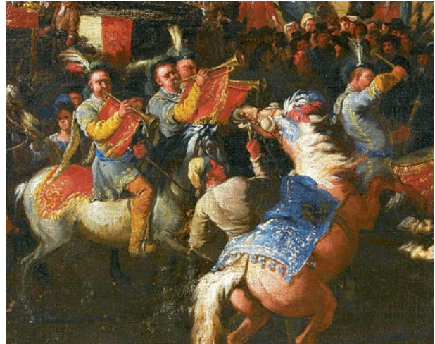
Мал. 8. Фрагмент картини «Вїзд Блумена Кодацці до Риму» роботи Пітера ван Блумена, 1680-ті рр. (© King John III Palace Museum, Wilanów).

Одяг військових музик Речі Посполитої у цей час мав цікаву особливість. Так, сурмачі та кінні добоші, судячи з живопису епохи, носили цікавий зразок верхнього плечового одягу, який був подібним на делійку, з коротким широким рукавом та полами довжиною до коліна. Цей плечовий одяг міг прикрашатися галуном, шнурами і,