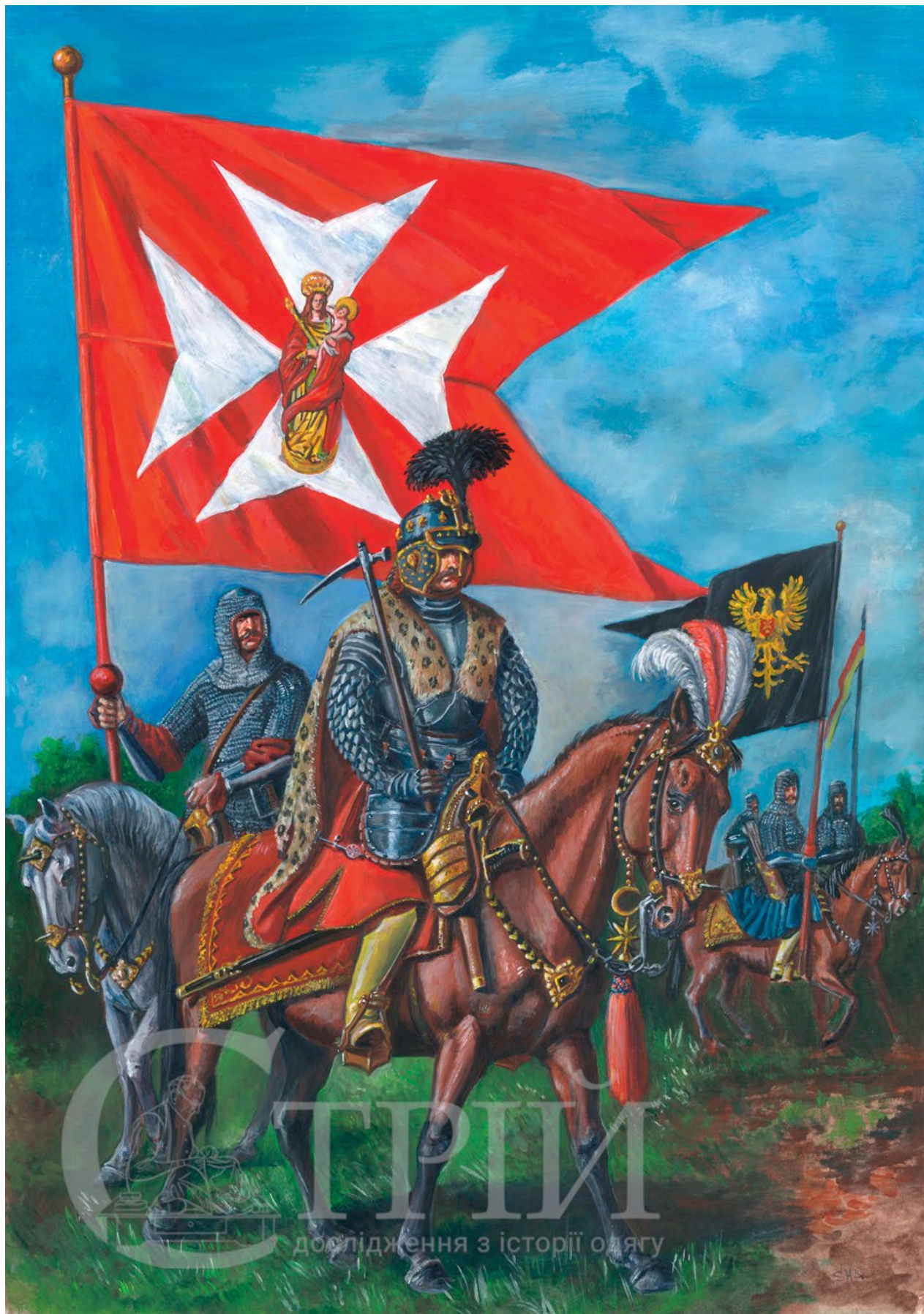
Мал. 5. Художня реконструкція поручника червоної гусарської хоругви Яна Барановського та вершників панцерних хоругв (© С. Шаменков).