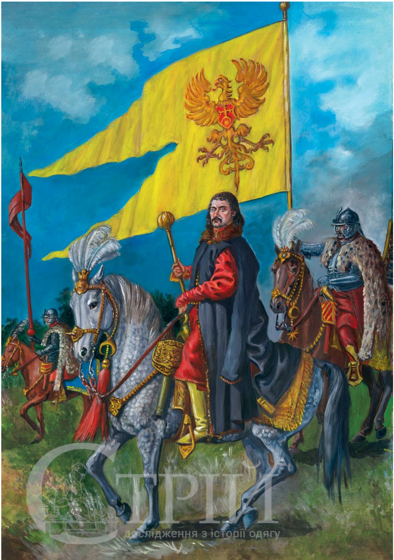
Мал. 4. Художня реконструкція воеводи руського, князя Яреми Вишневецького у супроводі гусарів особистої хоругви з прапором (© С. Шаменков).