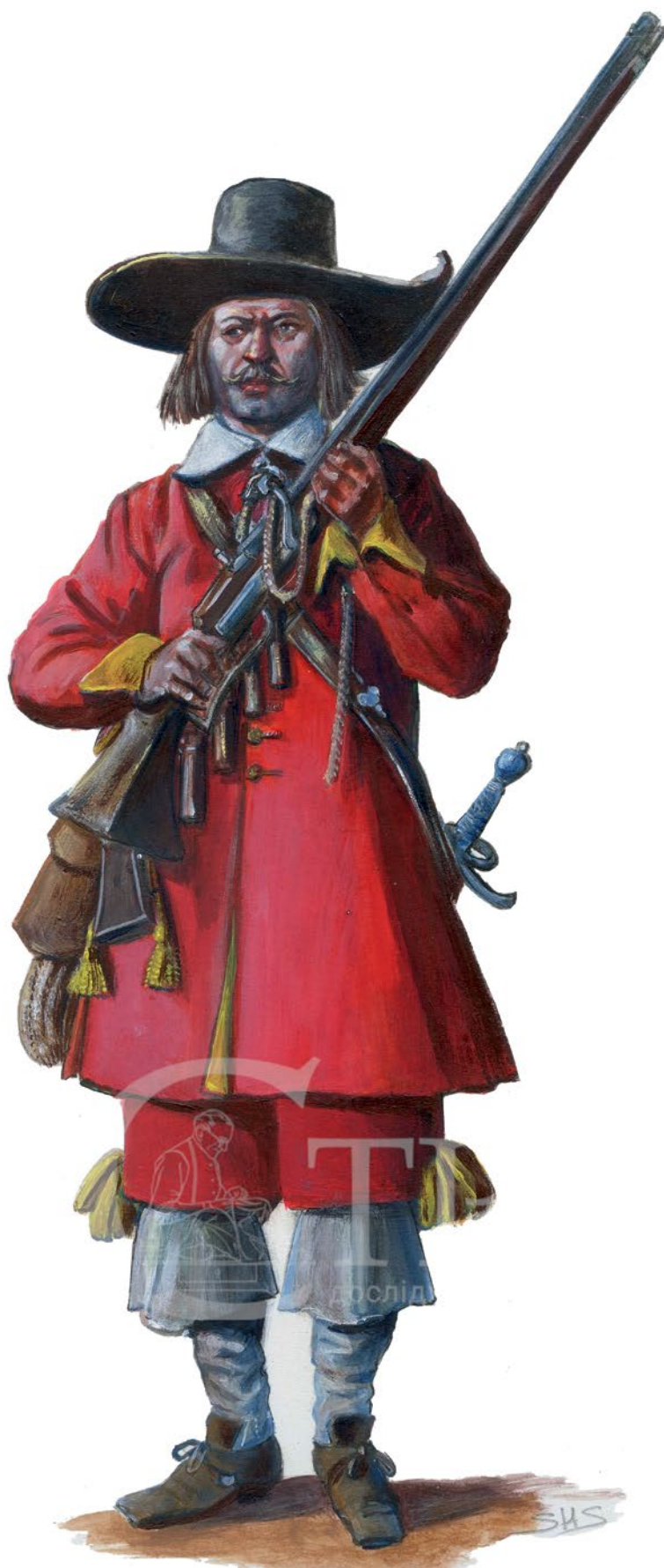
Мал. 7. Художня реконструкція драгуна князя Яреми Вишневецького (© С. Шаменков).