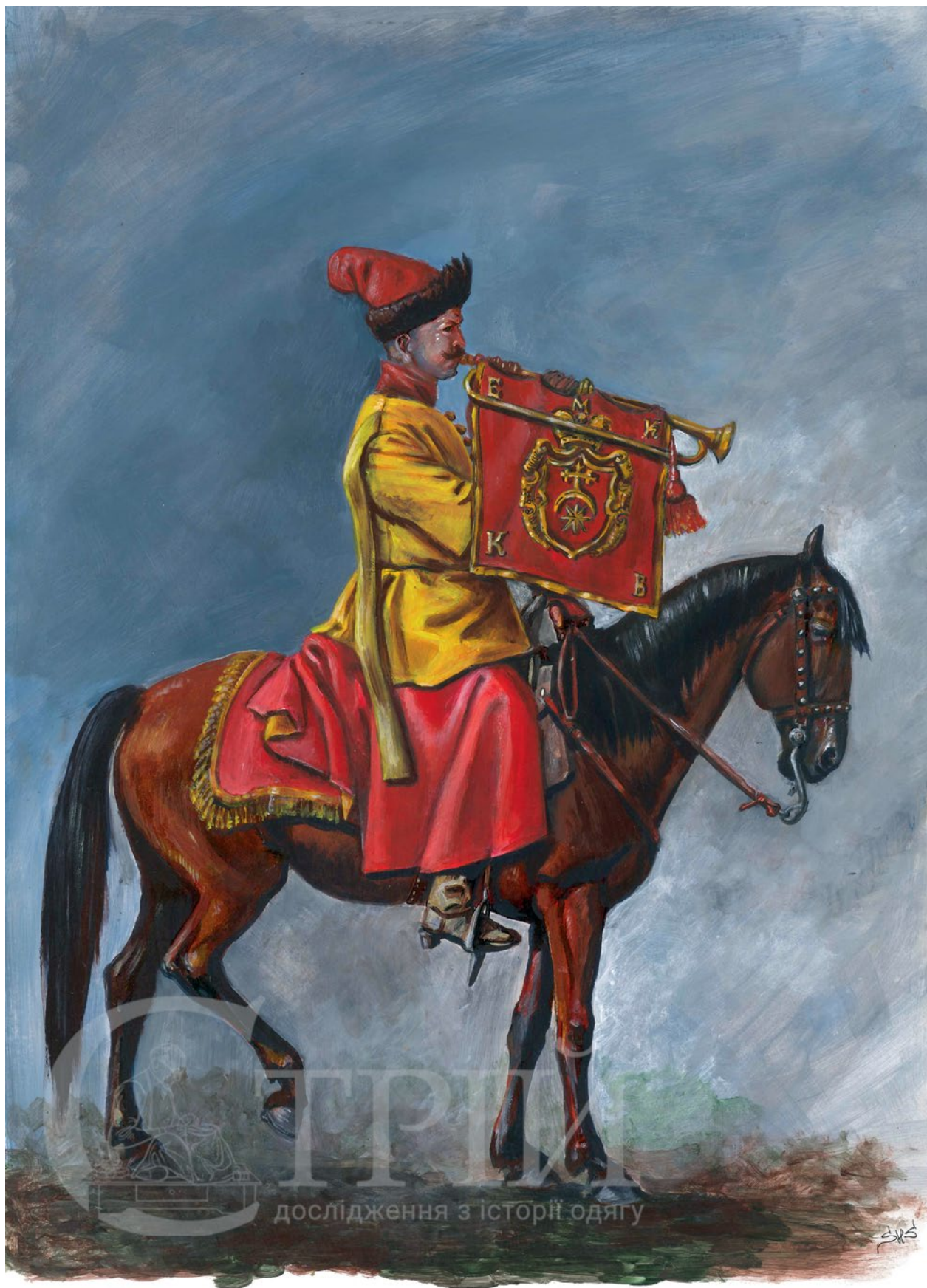
Мал. 9. Художня реконструкція музики надвірної хоругви князя Яреми Вишневецького (© С. Шаменков).