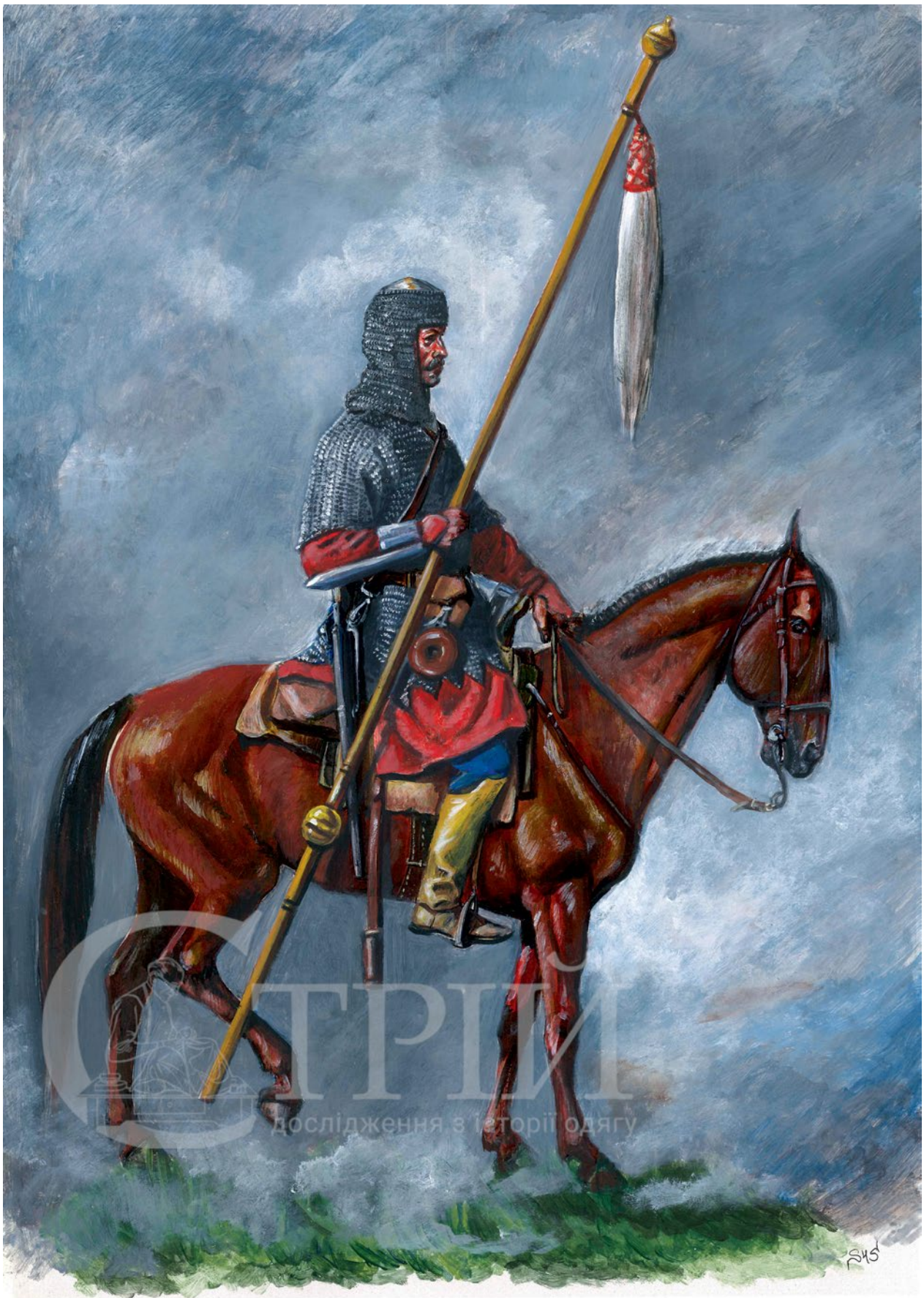
Мал. 6. Художня реконструкція панцерного надвірної хоргуви князя Яреми Вишневецького (© С. Шаменков).