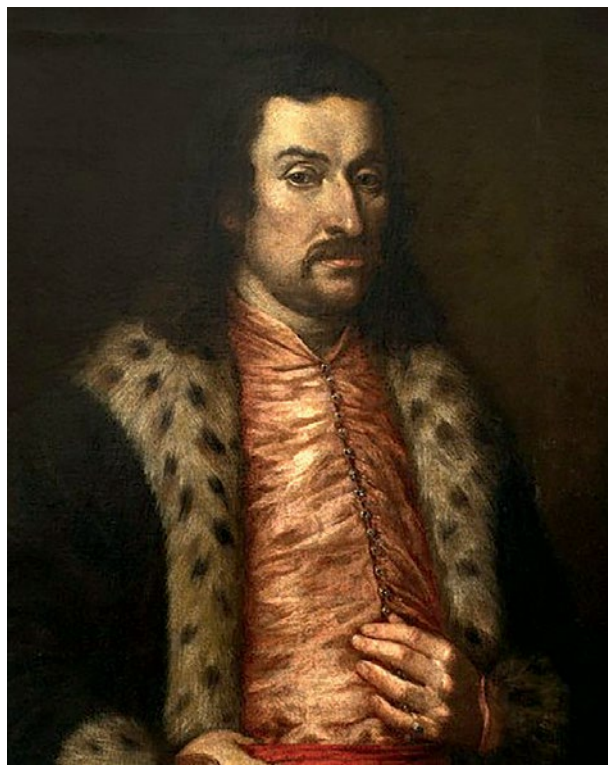
Мал. 1. Портрет князя Яреми Вишневецького роботи Даніеля Шульца, середина XVII ст. (за К. Bockenheim).

Друга згадка стосується поховання князя та опису його одягу: «Dnia 22 sierpnia (1651) t. j. na trzeci dzień po śmierci, odbyło się wyprowadzenie zwłok z obozu. Wśród podwójnego szeregu pułków, śpiewów żałobnych, odgłosu surm i bębnow, postępował kondukt, prowadzący «ciało, w trumnie włożone, smołą zalane, ubrane w żupan atlasowy karmazynowy, fereziją aksamitną włosianego koloru, kołpak aksamitny, koloru pomarańczowego» (Grabowski 286, 287).