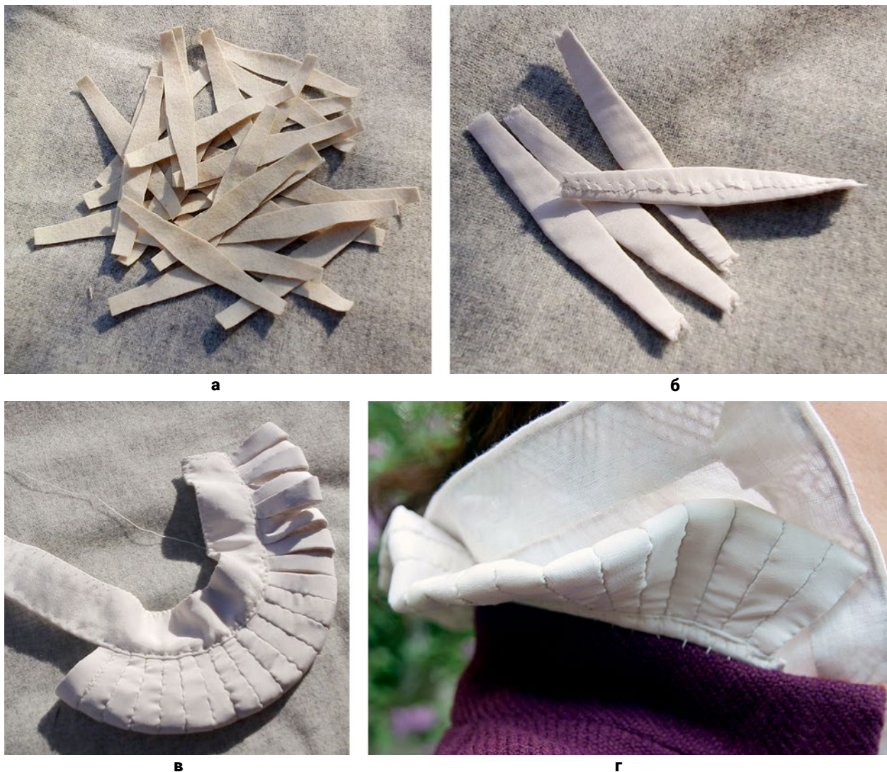
Рис. 11. Пікаділь: (а) – Пелюстки пікаділя зі щільного сукна (© Н. Скорнякова); (б) – Пелюстки пікаділя, обшиті шовковою тканиною (© Н. Скорнякова); (в) – Процес збірки пікаділя (© Н. Скорнякова); (г) – Готовий пікаділь, пришитий до коміра кабата (© І. Нікітіна).

Корпус з основної тканини з прикладом і підкладку з теракотового льону було зібрано окремо. Перш ніж приєднати підкладку до корпусу, по лінії талії було пришито вже готові деталі баски (Рис. 9, г), а в пройму – еполети.