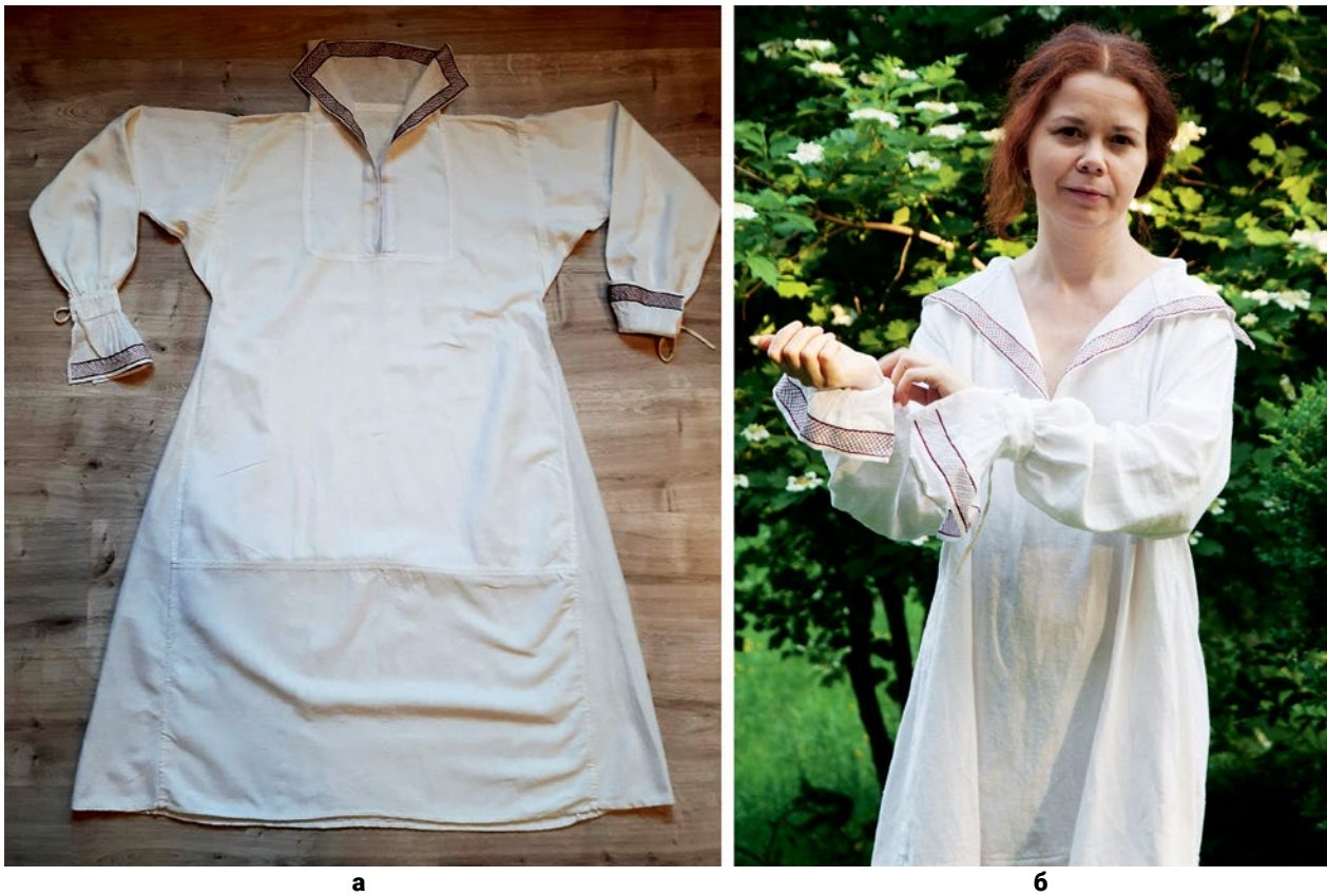
Рис. 3. Кошуля: (а) – Готова кошуля (© Н. Скорнякова); (б) – Кошуля на моделі (© І. Нікітіна).

Хоча на оригінальній іконі бачимо інший візерунок вишивки на манжетах, я вирішила зробити його таким самим, як на комірі (Рис. 4, в). Те, як відтворено манжети та як їх вшито в рукав, теж віддзеркалює швацькі техніки першої половини XVII ст. На сорочці Саломеї чітко видно, що манжет відстає від рукава, тобто його було відвернуто від зап'ястя нагору. Такі само характерні манжети бачимо на інших зображальних джерелах цього періоду (Рис. 1, г), іноді навіть з характерними «променями» (Рис. 1, д; Sidor and Lozynskiy 133). Ці промені – це дрібні витачки, за допомогою яких у XVII ст. комірам та манжетам надавали заокругленої форми (Рис. 2, а) («Manchet van linnen batist»). Вишитий манжет з'єднується з рукавом прямокутною смужкою тканини, по краях якої обшито дірочки для зав'язок (Рис. 4, г).