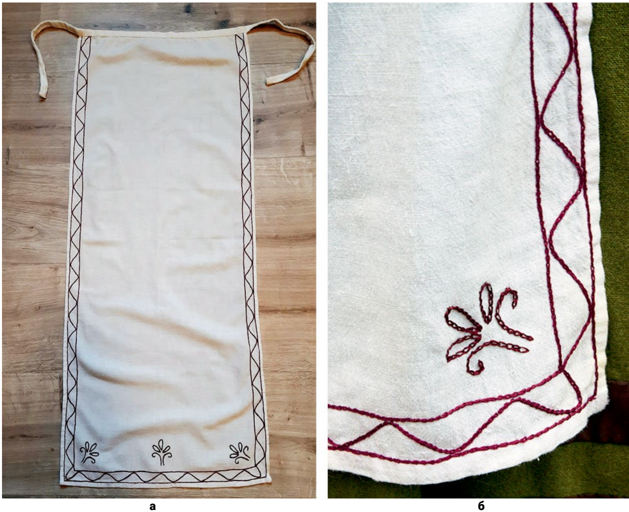
Рис. 5. Фартух: (а) – Готовий фартух (© Н. Скорнякова); (б) – Вишивка на фартусі (© Н. Скорнякова).

шов з'явився на українських землях пізніше, під східним впливом. У випадку тонкої фігурної вишивки більшість лляних речей першої половини XVII ст., які походять з теренів Речі Посполитої, декоровано або подвійним стібком «уперед голку», або стебловим (Рис. 2, б) («Welum»). Навіть наприкінці XVII – початку XVIII ст. найпоширенішою технікою залишалася однібічна гладь у поєднанні зі стебловим швом (Зайченко 11). Зразками для освоєння техніки тамбурного шва, ймовірно, стали східні вишивки (Зайченко 99), судячи зі зразків у колекції Чернігівського обласного історичного музею ім. В. В. Тарновського – не раніше, ніж у середині XVIII ст.