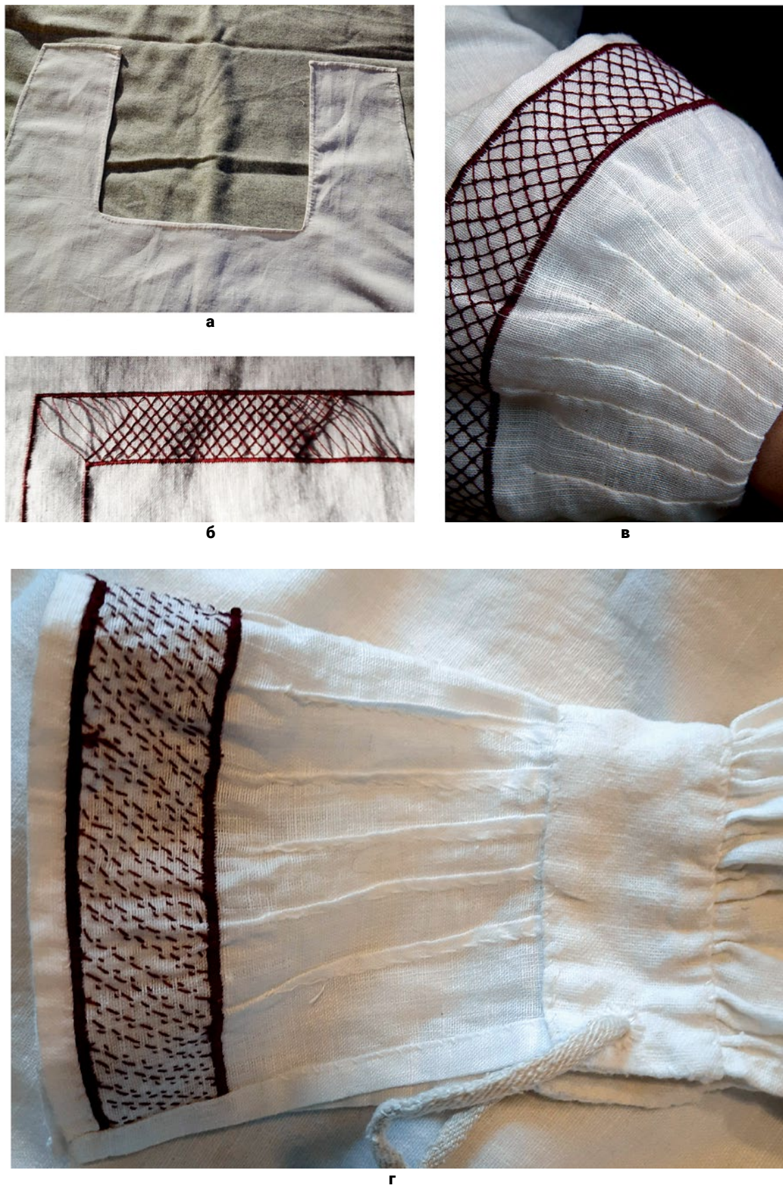
Рис. 4. Кошуля: (а) – Передній виріз на кошулі, в який буде вшито комір (© Н. Скорнякова); (б) – Вишивка коміра кошулі (© Н. Скорнякова); (в) – Манжет кошулі в готовому вигляді (© Н. Скорнякова); (г) – Зав'язки манжета кошулі (© Н. Скорнякова).