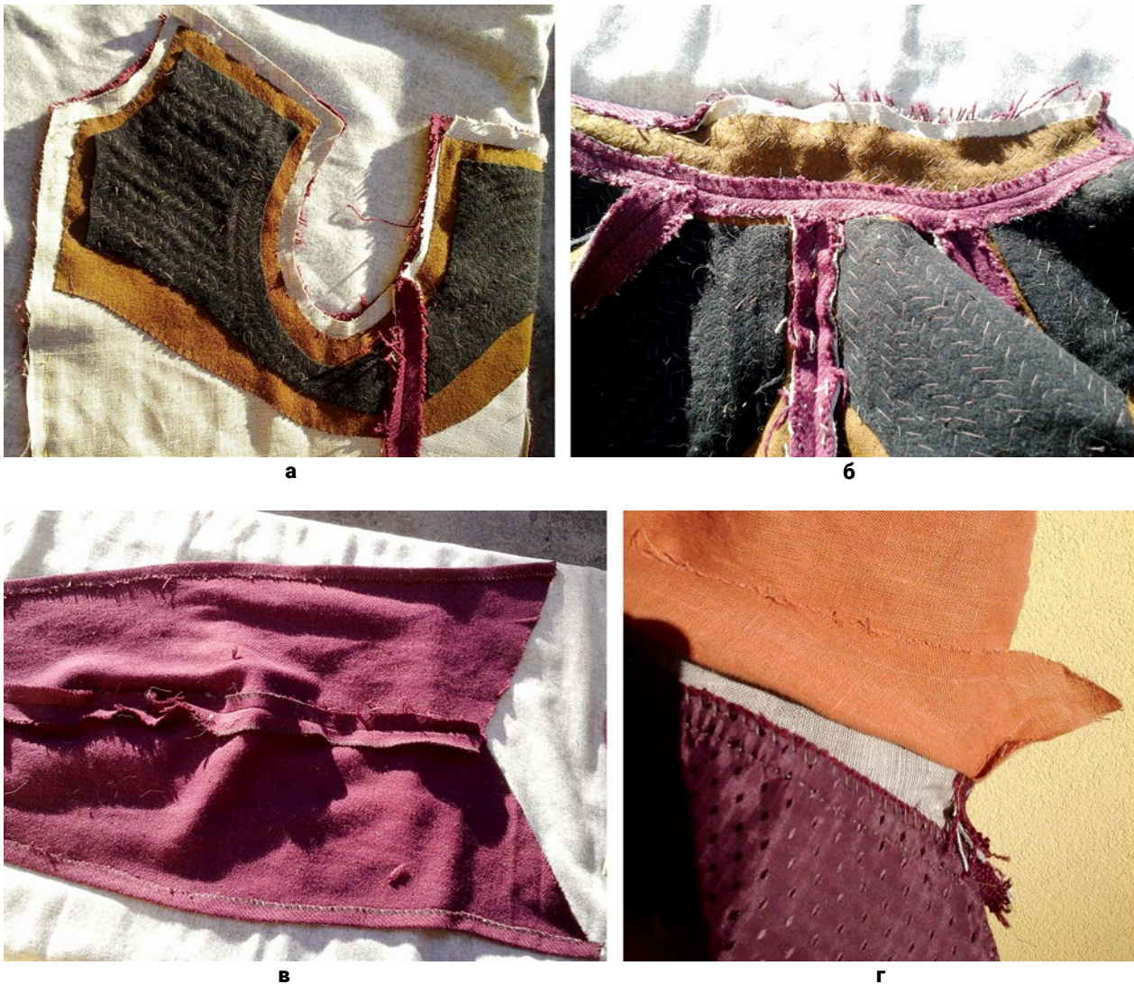
Рис. 9. Кабат: (а) – Ущільнення прикладу корсажа вовняними деталями (© Н. Скорнякова); (б) – Комір, пришитий до корпусу (© Н. Скорнякова); (в) – Відкидні рукави, зібрані з основної тканини (© Н. Скорнякова); (г) – Баска, пришита до корпусу, та лляна підкладка корпусу (© Н. Скорнякова).

(Braun et al. 97). Застібку на гудзики я замінила на застібку на металеві гачки та петлі, оскільки в той же час створювала інший проект з жакетом на гудзиках (який планую обговорити в окремій праці). Крій корпусу повторює крої багатьох дублетів першої пол. XVII ст., як жіночих, так і чоловічих (Arnold Patterns of Fashion 3 85, 89, 106). Крій відкидних рукавів було запозичено з гоуна сера Френсіса Вернея, який датують 1605–1615 рр. (Arnold Patterns of Fashion 3 100).