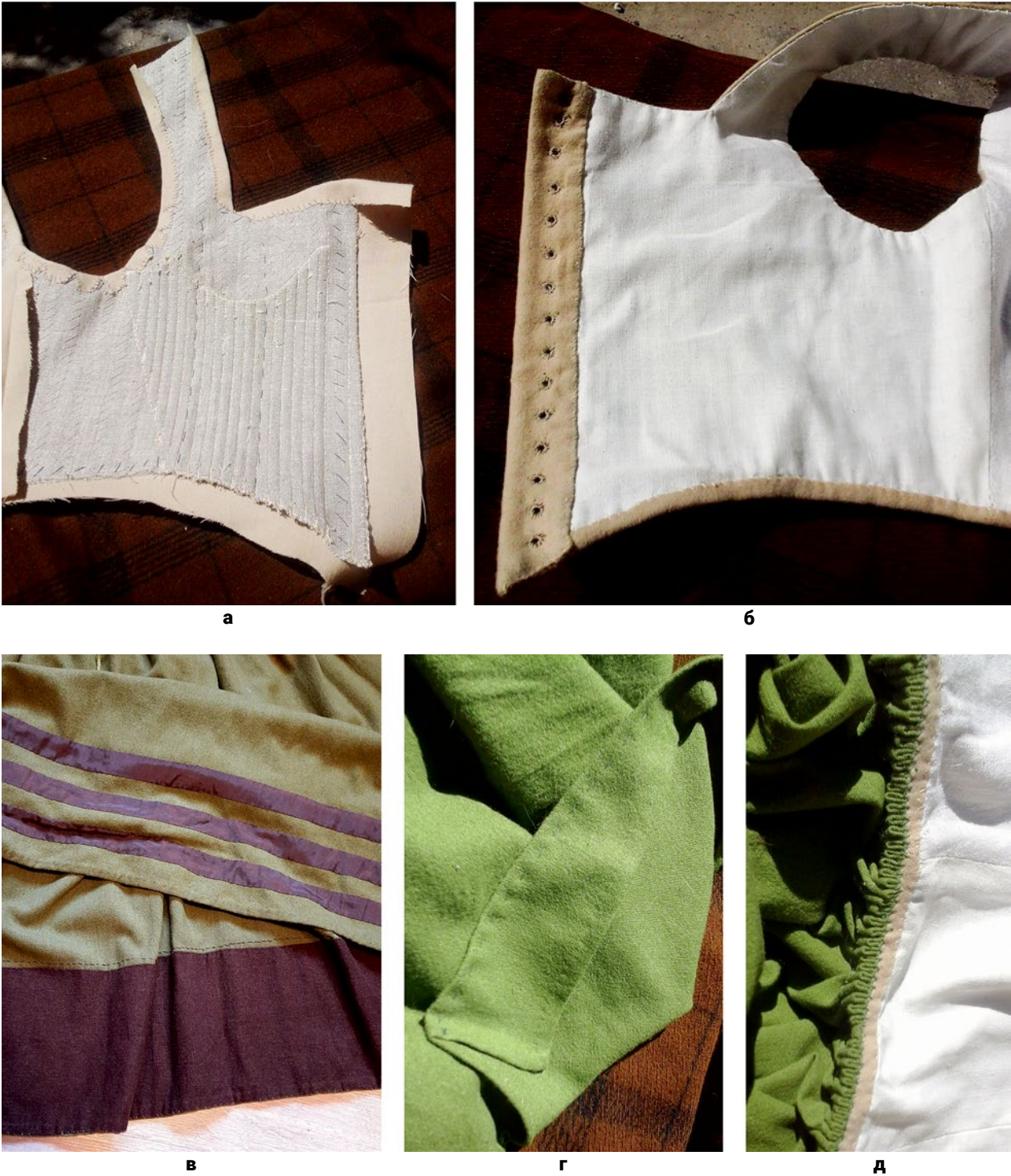
Рис. 7. Корсаж та спідниця: (а) – Лляний приклад корсажа, простьобаний та зі вставленими кісточками (© Н. Скорнякова); (б) – Готовий корсаж з вивороту (© Н. Скорнякова); (в) – Лляна підшивка подолу спідниці та декор шовковими смугами (© Н. Скорнякова); (г) – Верхній зріз спідниці (© Н. Скорнякова); (д) – Картріджні складки спідниці (© Н. Скорнякова).

поєднувалися в одне ціле за допомогою стібків у складках. Ці нитки можна було легко спороти та пришити нову спідницю або корсаж. Готову сукню представлено на (Рис. 8, а, б).