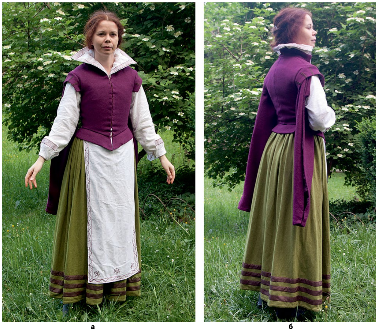
Рис. 12. Готовий комплект: (а) – Готовий комплект: вид спереду (© І. Нікітіна); (б) – Готовий комплект: вид зі спини (© І. Нікітіна).

репрезентативних портретах та інших реалістичних зображеннях – як деталь сукні перших років XVII ст. (наприклад портрет Христини Любомирської (Рис. 1, е; Drażkowska Odzież grobowa 113)), на іконах – як деталь коротких кабатів першої чверті XVII ст. («Усікновення голови Івана Хрестителя»). У нижній частині рукав застібається на гачки та петлі (Рис. 10, г).