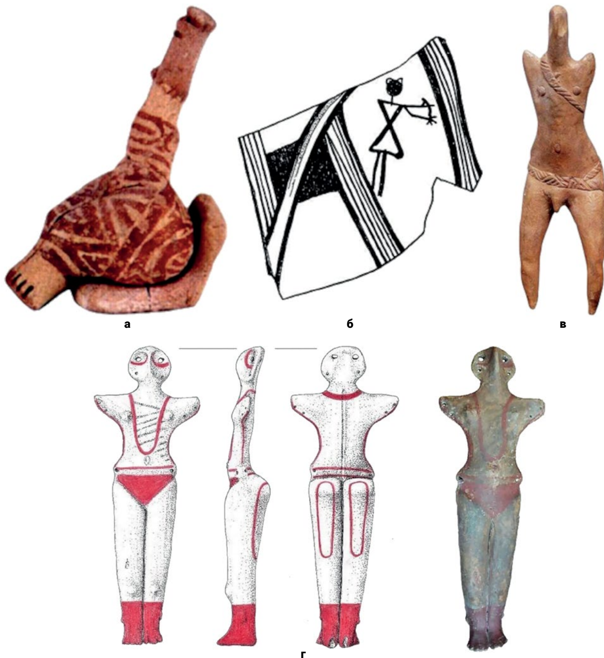
Мал. 1. (а) – Жіноча фігурка, Подурі (за І Палагутою); (б) – фрагмент посудини з жіночою фігурою, Жванець (за І. Палагутою); (в) – чоловіча фігурка, Думешті (за І. Палагутою); (г) – фігурка з Кошилівець (за Я. Яковишиною і О. Куценяк). Чітко видно, що низ ноги пофарбований, при цьому пророблені пальці, що вочевидь показує саме пофарбовані ноги, як і на багатьох інших фігурках, а не якісь чобітки.

просто зачіска. Натомість до жіночих головних уборів можна віднести чіткі зображення в'язаних сіток для волосся на фрагментах глиняної пластики (Єрмолаївка). Існують спроби, на нашу думку помилкові, інтерпретувати низку схематичних фігурок без детальних рис як зображень жінок у великих циліндричних шапках. Але тут ми скоріш за все маємо справу з зображенням