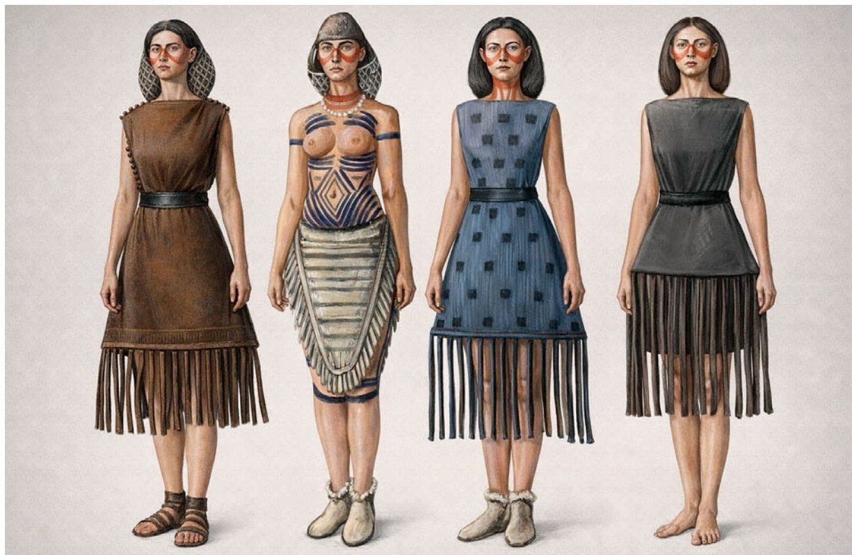
Мал. 6. Результат обробки авторської художньої реконструкції інструментами генеративного ШІ – ChatGPT 5.2.