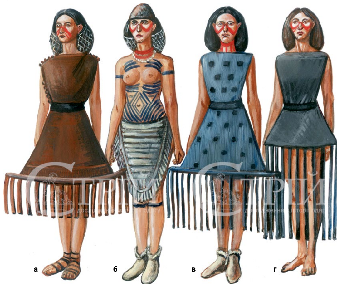
Мал. 5. (а–г) – Художні реконструкції трипільців. Можливі варіанти безрукавних «суконь» та попередників (© С. Шаменков).