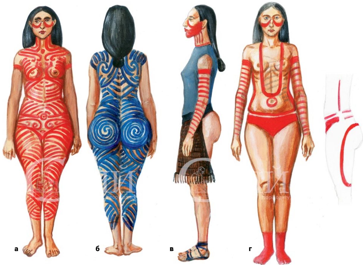
Мал. 3. (а-г) – Художні реконструкції трипільців. Можливі варіанти поєднання розпису тіла та настегнових пов'язок (© С. Шаменков).