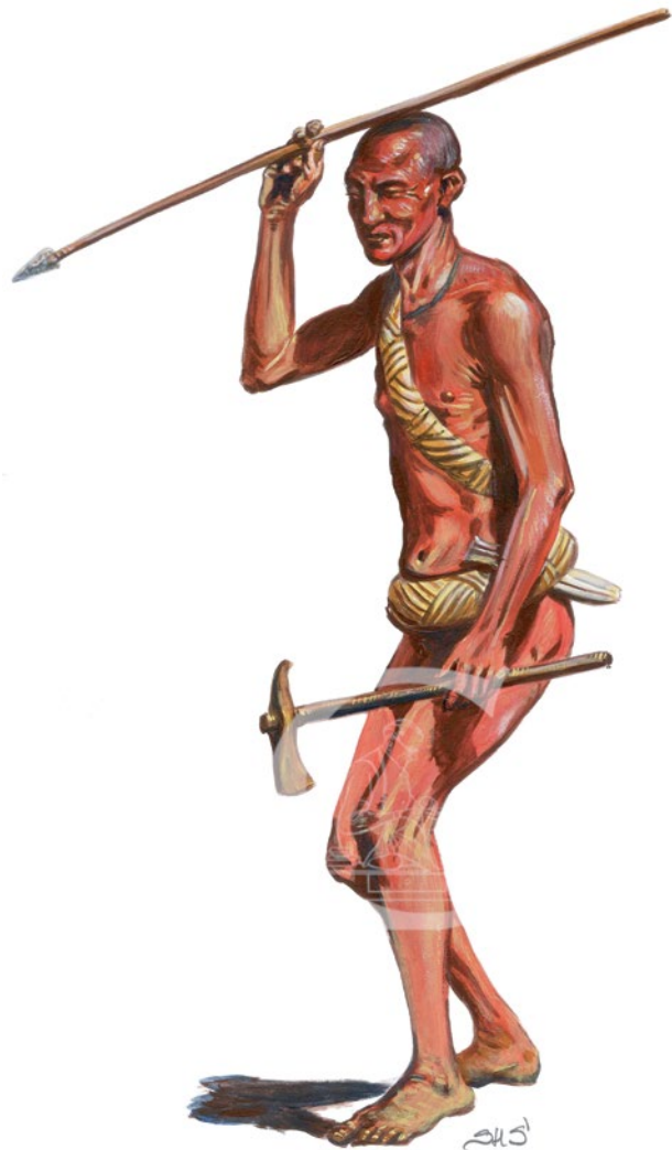
Мал. 7. Художня реконструкція воюка культури Кукутень-Трипілья (© С. Шаменков).

Матеріалом для пошиву окремих видів одягу слугувала тканина, шкіра та хутро. Трипільці використовували у домогосподарстві