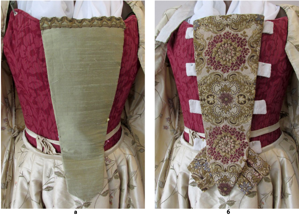
Мал. 4. Загальний вигляд виготовлених для комплекту стомаків: (а) – з однокольорової шовкової тканини; (б) – з бавовняного брокарду, прикрашеного рослинним орнаментом.

156–161). Було використано шовкову тканину з рослинним декором, яка була надана замовником, лляну тканину, шовкові та лляні нитки та металізоване мереживо.