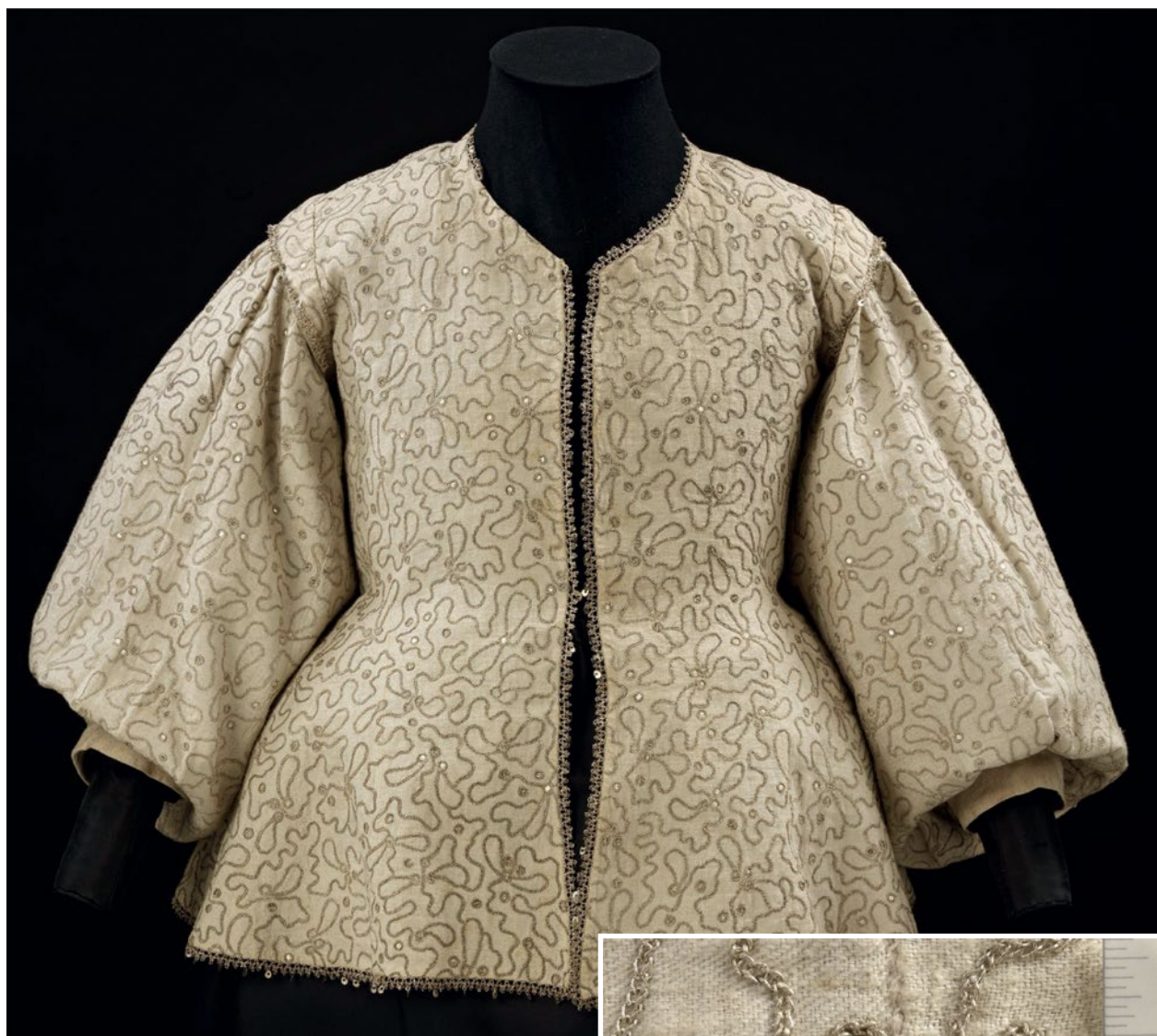
Рис. 1. Женский жакет 30–40-х годов XVII в. из молочно-белого фустяна.

z rękawikami, podszyty barchanem» (Zielińska 153). А в львовских актах от 1649 г. упоминаются «3 Sztuki Bowchanu białego po groszy 10» и «20 Łokci Barchatu białego po groszy 13½» (Акты комісії при- сяжних ар.1866).