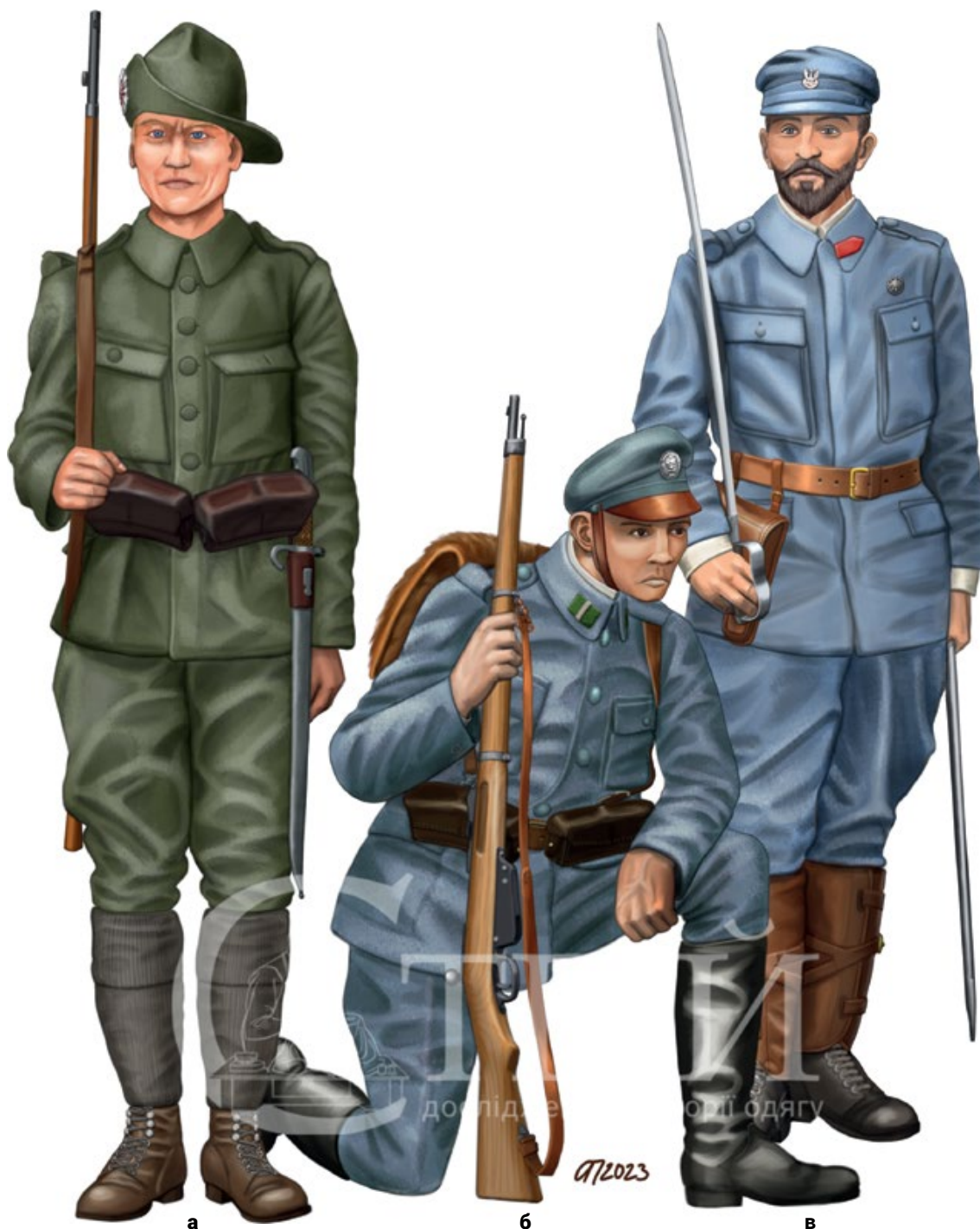
Мал. 13. Художні реконструкції одностроїв польських парамілітарних організацій Східної Галичини (© А. Папакін):

(а) – Член «Польових дружин Сокола», 1913–1914 рр. Польовий однострій складається з капелюха з біло-червоною кокардою, кітеля і штанів кольору хакі; на ногах шкіряні черевики, а замість гетрів – високі вовняні шкарпетки. «Сокіл» озброєний застарілою однозарядною гвинтівкою системи Верндля М1867/77 та ятаганим багнетом до неї. (б) – Командир відділення «Польських стрілецьких дружин», 1913–1914 рр. Його однострій складається з «мацеювки», кітеля і штанів сірого кольору. На кашкеті – металевий знак з орлом і номером дружини. Парні петлиці на комірці позначають звання. Стрелець взутий у чоботи. Він озброєний гвинтівкою системи Маннліхера М1888. На поясі – підсумки для набоїв, за плечима – шкіряний ранець австро-угорської армії. (в) – Ротний командир «Стрільцького союзу», 1914 р. Офіцер одягнений у сірий однострій цієї організації, взутий у черевики зі шкіряними крагами. На комірці – одиночна червона п'ятикутна петлиця, що позначала посаду командира роти. На грудях має «парасоллю» – відзнаку про закінчення вишколу. Офіцер озброєний піхотною шаблею австро-угорської армії та револьвером Раста-Гассера М1898 у шкіряній кобурі.