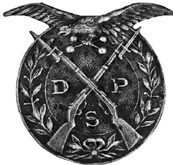
Мал. 3. Кашкетний знак «Польових дружин Сокола» (за В. Mincer).

При урочистому однострої на кашкеті чіпляли біло-червоні кокарди з тканини і металевий знак із зображенням сокільського орла – птаха з випростаними крилами і гантеллю в лапах. Для «польових дружин» передбачався