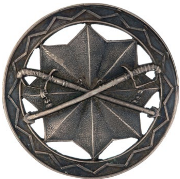
Мал. 9. «Парасоля» – відзнака випускників офіцерських курсів «Стрілецького союзу».

Польовий однострій цього товариства (Мал. 10 а, б) («Fotografia grupowa»; «Związek Strzelecki») (Мал. 13 б) виник восени 1912 р. Він складався з кашкету-«мацеювки», кітеля, штанів, черевиків і двобортної шинелі. «Мацеювка» мала чорні шкіряні дашок і підборідний ремінь. Кітель мав стояче-відкладний комір, чотири накладні кишені і погони; застібався на п'ять