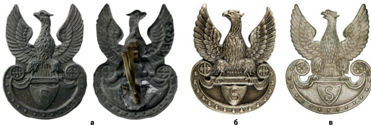
Мал. 7. Кашкетні знаки «Стрілецького союзу», 1913–1914 рр. (© Muzeum Narodowe w Krakowie).