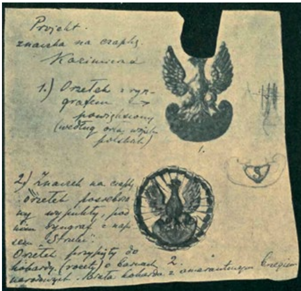
Мал. 8. Проект кашкетного знака «Стрілецького союзу», 1913 р. (за С. Jarnuszkiewicz).

найчастіше між тулією та верхом. Такі орли на кашкетах стрільців з'явилися восени 1913 р., а з 1 травня 1914 р. носіння їх стало обов'язковим (Zawistowski «Orły» 67) (Мал. 7 а–в) («Orzeł strzelecki» (1); «Orzeł strzelecki» (2); «Orzeł strzelecki «Kadrowy»»).