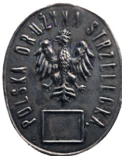
Мал. 11. Кашкетний знак члена «Польських дружин стрілецьких», 1913 р. (за J. Nowak).

на лівому кінці коміра, і лише на тренуваннях – на двох: біла петлиця у рядових, біла з темно-зеленою смугою посередині у старшого солдата, темно-зелені та кармазинові з вертикальними смугами – у підофіцерів і офіцерів (Wielecki 244). Ймовірно, саме з такими