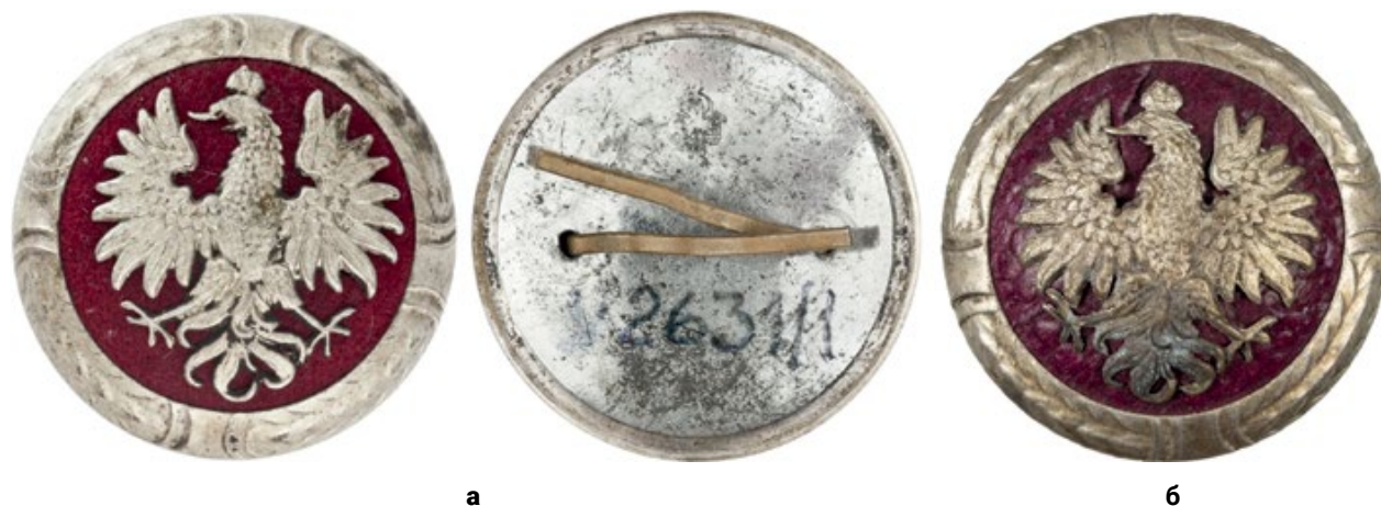
Мал. 5. Кашкетні знаки «Бартошових дружин», 1914 р..