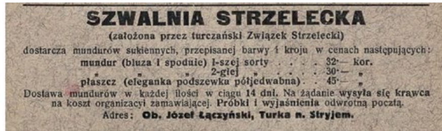
Мал. 12. Оголошення про виготовлення елементів одностроїв польських парамілітарних організацій. Газета «Strzelec», 1914 р.

«спеціальними відзнаками» побачив командирів підрозділів дружин під час маневрів 31 травня – 1 червня 1914 р. «дружиняк», а згодом офіцер Польських легіонів та генерал бригади Війська Польського Юзеф Вільчинський–«Ольшина» (Olszyna-Wilczyński 15).