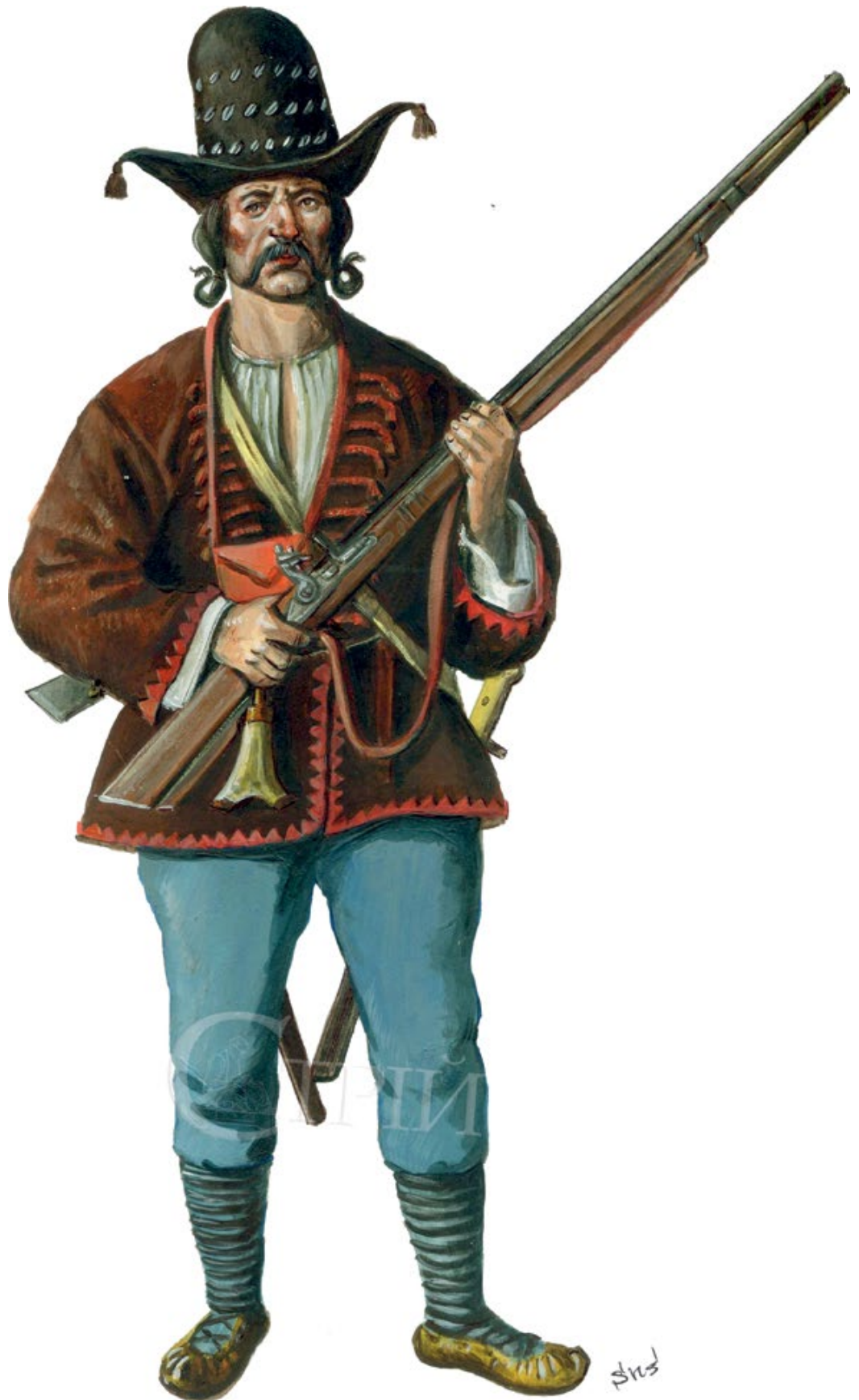
Мал. 4. Графічна реконструкція смоляка першої половини XVIII ст., створена на основі живописної таблиці «Танок зі смертю» з Монастиря сестер домініканок святої Анни у с. Пширув (© С. Шаменков).