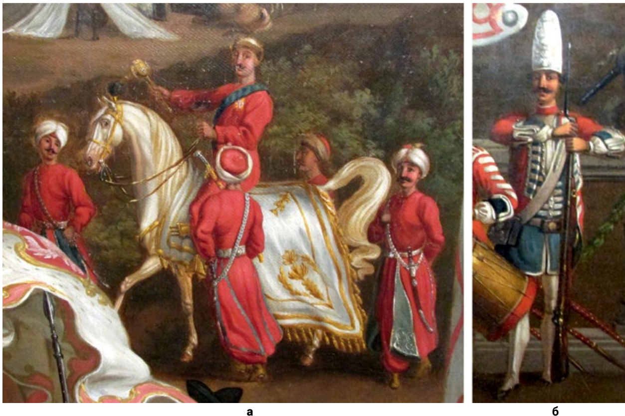
Мал. 7. (а) – Гетьман Ю. Потоцький в оточенні чаусів, фрагмент полотна « Kamrarent na polach czerniakowskich i królikarni w 1732 roku » Я. Мока з колекції Музею Війська Польського. Приблизно так міг виглядати одяг гетьмана під час кампанії проти опришків (© С. Шаменков). На парадних портретах гетьман Ю. Потоцький зображений у металевих обладунках та опанчі з орденами, але слід пам'ятати, що такі зображення, як і зображення зі шкірою через плече, для того часу залишилися лише даниною портретній моді. (б) – Гренадер Полку Великої Булави, фрагмент полотна « Kamrarent na polach czerniakowskich i królikarni w 1732 roku » Я. Мока з колекції Музею Війська Польського. Хоча гренадери і не стаціювали у Станіславі, але на цьому фрагменті видно мундир полку (© С. Шаменков).

полотном (Мал. 7, а), а решта підофіцерів та жовнірів – високі ковпаки « kulah » з оздобою та мосяжною бляхою « uskinf » попереду, подібною на аналогічні в турецьких яничар (Gerner 66). У верхній частині мосяжної бляхи було відчеканено королівський вензель під короною.