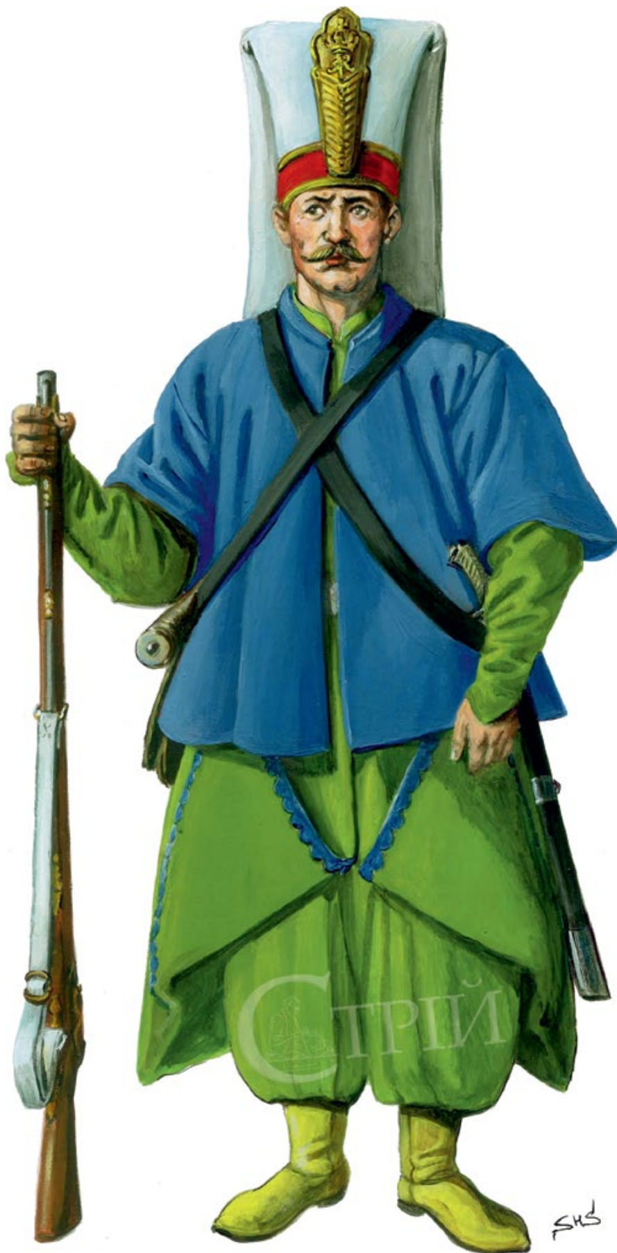
Мал. 8. Графічна реконструкція яничара з яничарської хоругви Великої Булави (© С. Шаменков).