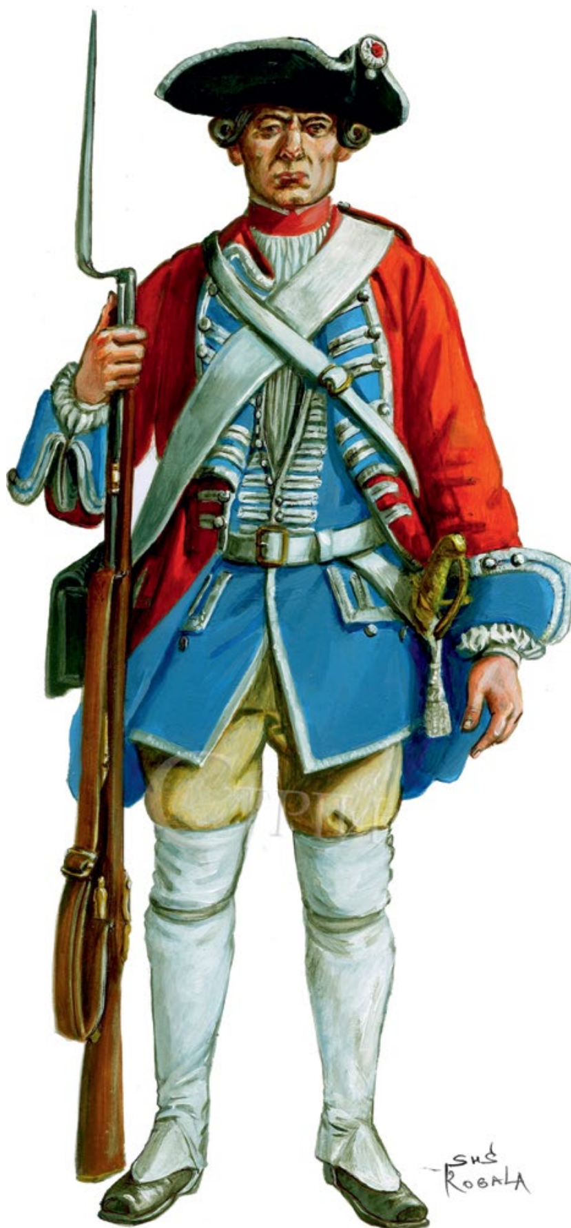
Мал. 9. Графічна реконструкція жовніра Регіменту Великої Булави 1740-х рр. (© С. Шаменков).