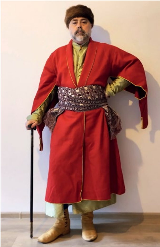
Мал. 12. Реконструкція чоловічого шляхетського одягу другої чверті XVIII ст. (© С. Шаменков).

У якості прикладів зовнішнього вигляду гайдуків першої половини XVIII ст. можна навести зображення 1719 р., що показує саксонського гайдюка, з колекції Державних художніх зібрань Дрездена («Heiduck»), та фрагмент полотна авторства Я. Мока з колекції Музею Війська Польського, що показує гайдуків серед польсько-саксонських військ у 1732 р. (Мал. 11, а).