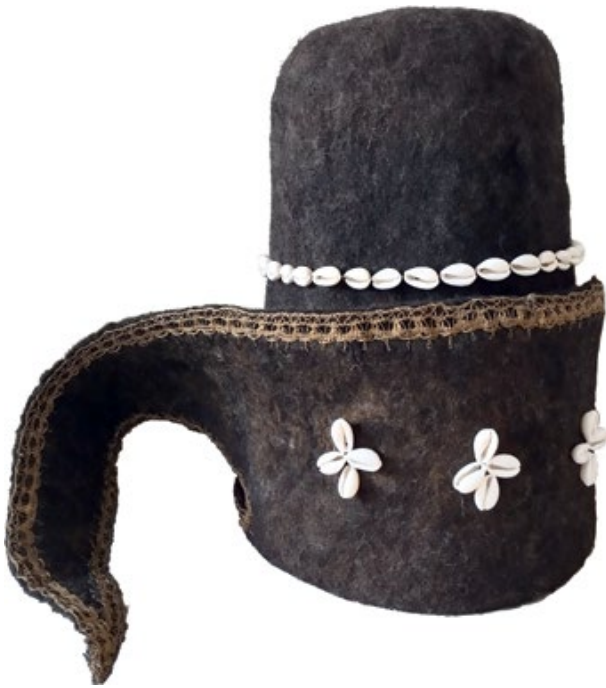
Мал. 2. Реконструкція повстаного ковпака. Валяний повстаний ковпак з брунатної вовни, прикрашений мушлями каурі, а по краю лопаті обшитий металізованим мереживом (© С. Шаменков, Б. Дерев'яга).

з Монастиря сестер домініканок святої Анни в с. Пширув (Польща) («Zakrystia»). На таблиці показано постать у темно-коричневого (брунатного) кольору одязі (подібному на коротку гірську серм'ягу чи катанку), облямованому по краю червоними трикутниками, а на грудях прикрашеному червоними шнурами. Постать зображена у високій шапці з лопатями, китицями та прикрасами-мушлями, в сіро-синіх вузьких штанах та постолах. Озброєний він рушницею та, ймовірно, тесаком на боці. Серед іншого спорядження цікаво відмітити невелику червону лядунку для набоїв.