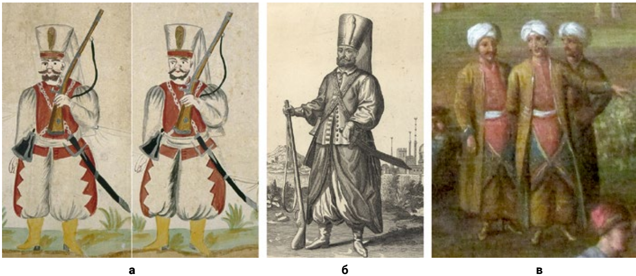
Мал. 6. (а) – Підрозділ саксонських яничарів під час параду в Дрездені в 1736 або 1738 р. (© Universitätsbibliothek Freiberg). (б) – Яничар з яничарського підрозділу Августа II Сильного (© The National Museum in Krakow). (в) – Жовніри яничарської хоругви, фрагмент полотна «Kampanent wojsk polskich, saskich i litewskich na Czerniakowie 31 lipca – 18 sierpnia 1732» Я. Мока із колекції Королівського замку у Варшаві (© С. Шаменков).

(Archiwum Narodowe w Krakowie) 3 . Згаданий бламарантовий колір – це відтінок світло-синього, а папужий – зелений, трав'янистий колір: « Kolor rapuzy abo trawisty ». Такі кольори жупанів та шаровар, зображені на персонажах у яничарському одязі з полотна «Kampanent wojsk polskich, saskich i litewskich na Czerniakowie 31 lipca – 18 sierpnia 1732» (Мал. 6, в) авторства Я. Мока із колекції Королівського замку у Варшаві.