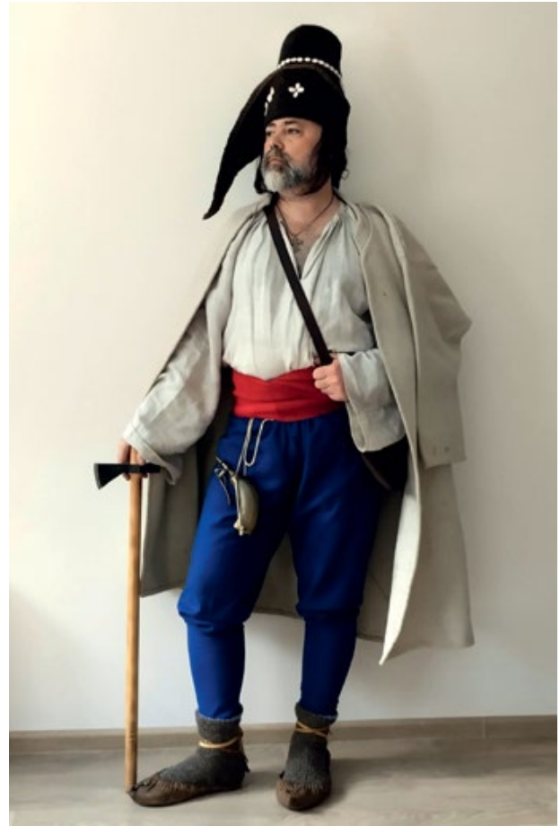
Мал. 3. Стилізація-реконструкція горянина першої половини XVIII ст. У подібний одяг вбиралися як опришки, так і смоляки (© С. Шаменков).

За часів гетьмана Ю. Потоцького яничарська хоругва Великої Булави налічувала 98–99 осіб: