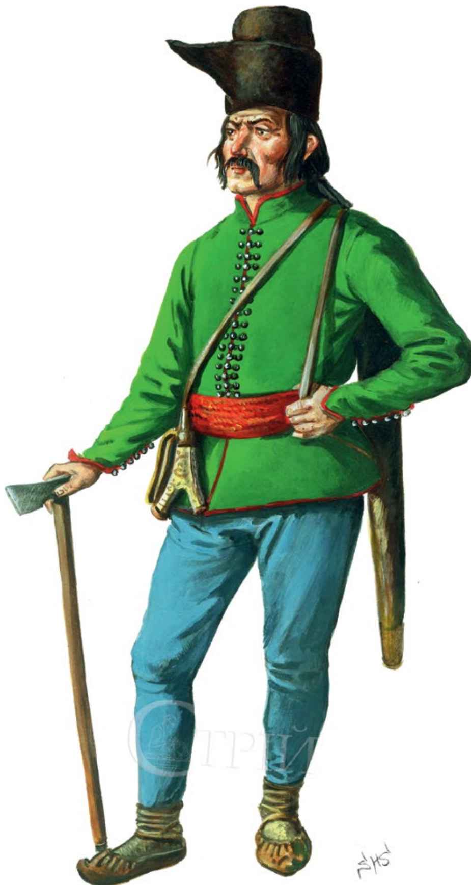
Мал. 5. Графічна реконструкція горянина першої половини XVIII ст., створена на основі церковних розписів карпатського регіону. Так цілком міг виглядати як опришок, так і вояк смоляцької служби. На персонажі одягнена зелена куртка крою, близького до доломана, а свою рушницю-цешенку він тримає у шкіряному чохлі (© С. Шаменков).