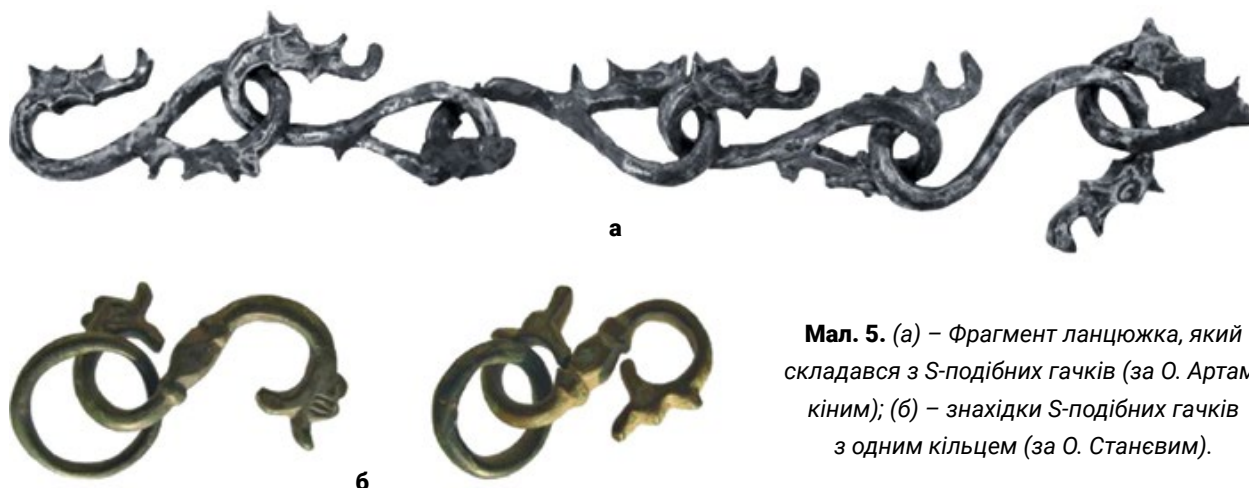
Мал. 5. (а) – Фрагмент ланцюжка, який складався з S-подібних гачків (за О. Артамкіним); (б) – знахідки S-подібних гачків з одним кільцем (за О. Станевим).

в неї є надзвичайно близький аналог з Болгарії. Цей фрагмент застібки з S-подібним вертикальним гачком зараз зберігається в Історичному музеї м. Котел (Болгарія) (8.9) (Мал. 4, з) (Станев 150, 153; Трендафилова 149, 157). Місце знахідки невідоме. Ширина рамки з петлею – 27 мм, довжина рамки з петлею – 32 мм, а матеріал – бронза. В обох випадках ми можемо бачити майже ідентичну форму рамок з петлею та декор S-подібного гачка, прикрашеного кульками з косими насічками.