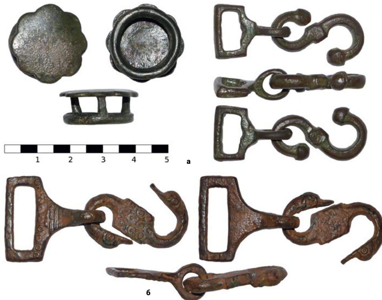
Мал. 9. (а) – Фрагмент застібки, знайдений у Харківській обл. (12.1); (б) – фрагмент застібки, знайдений в Одеській обл. (12.2).

гачка – 27 на 16 мм, його середня частина прикрашена кубічним потовщенням, а кінчики – декоративними пасками.