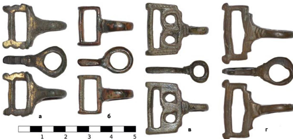
Мал. 7. (а) – Фрагмент застібки, знайдений поблизу с. Вартиківці Чернівецької обл. (10.1); (б) – фрагмент застібки, знайдений в Одеській обл. (10.2); (в) – фрагмент застібки, знайдений поблизу с. Хухра Сумської обл. (10.3); (г) – фрагмент застібки, знайдений в Одеській обл. (10.4).