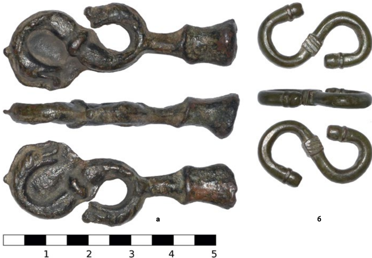
Мал. 8. (а) – Ливарна відливка із S-подібним гачком, що була знайдена у Вінницькій обл. (11.1); (б) – S-подібний гачок, знайдений в Одеській обл. (11.2).

кінчик гачка прикрашені кулястим потовщенням. Застібка двостороння. Розміри та декор зближують її з фрагментом застібки (9.7) та застібною (4.9).