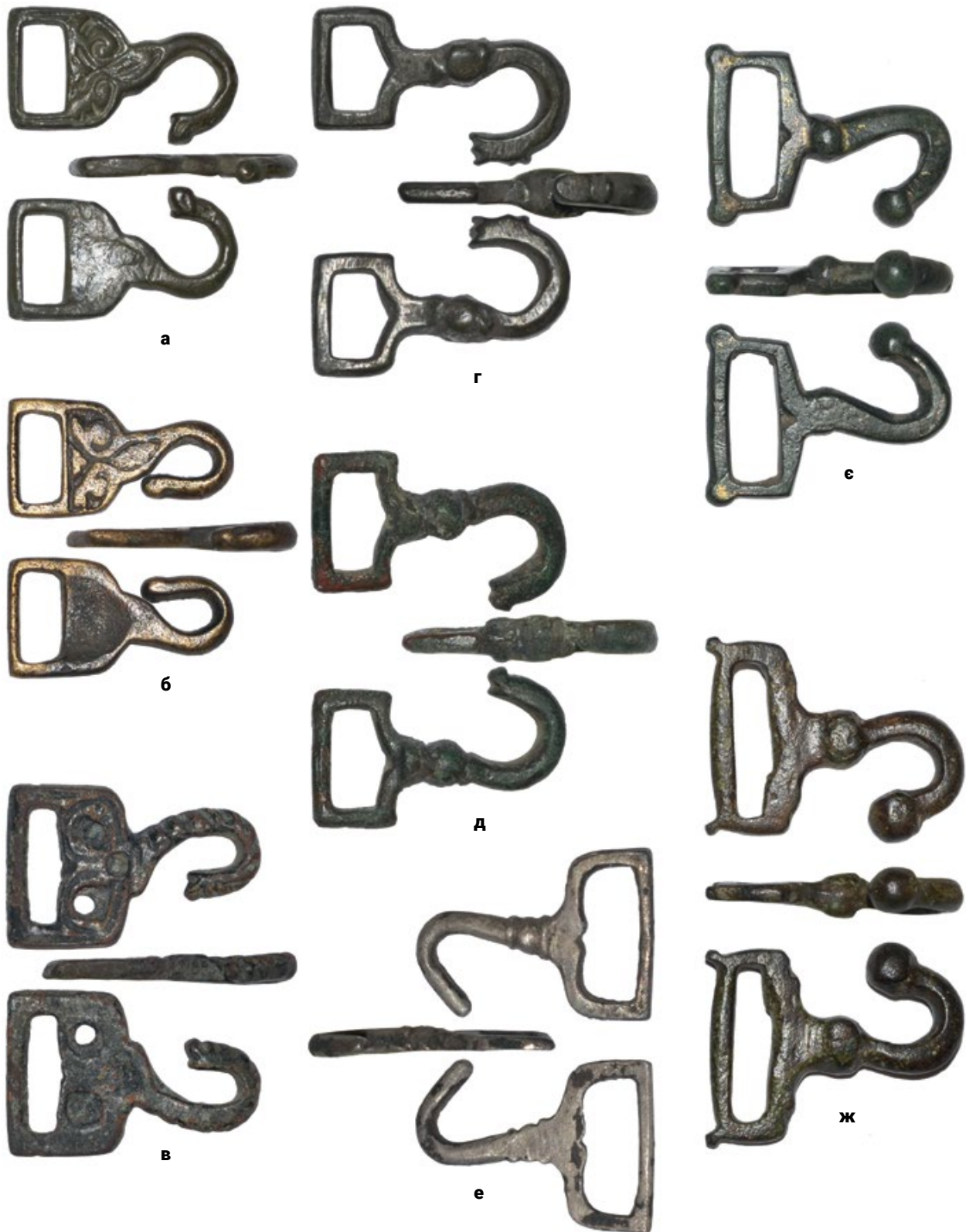
Мал. 6. (а) – Фрагмент застібки, знайдений у Сумській обл. (9.1); (б) – фрагмент застібки невідомого походження (9.2); (в) – фрагмент застібки невідомого походження (9.3); (г) – фрагмент застібки невідомого походження (9.4); (д) – фрагмент застібки невідомого походження (9.5); (е) – фрагмент застібки, знайдений у Волинській обл. (9.6); (е) – фрагмент застібки, знайдений поблизу с. Семенів Тернопільської обл. (9.7); (ж) – фрагмент застібки невідомого походження (9.8).