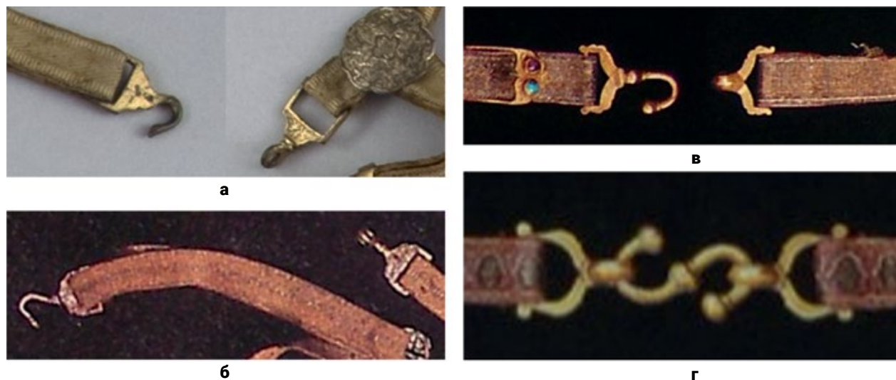
Мал. 3. (а) – Застібка підвісу польської карабелі XVIII ст. (4.1) (© Muzeum Narodowe w Krakowie); (б) – застібка підвісу карабелі другої половини XVII ст. (4.2) (© Muzeum Wojska Polskiego w Warszawie); (в) – застібка підвісу меча, що належав сподвижнику пророка Мухаммада Халіду ібн аль-Валіду (4.9) (за Н. Aydin); (г) – застібка підвісу меча, що належав книжнику пророка Мухаммада Абу Хасану (5.7) (за Н. Aydin).

половина XVII ст.) (зібрання ЗПКМ, інв. номер Ор-4431) (Тихомирова и Мартынова). Шабельний підвіс повністю зберігся, гачок розташований на правому боці.