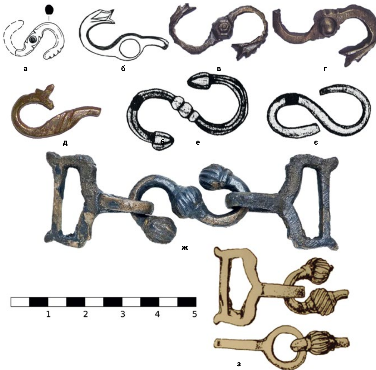
Мал. 4. (а, б) – Фрагменти S-подібних гачків XVI–XVIII ст., що були віднайдені при розкопках на території Хотинської фортеці (8.1, 8.2) (за С. Пивоваровим та В. Калініченком); (в, г) – S-подібні гачки XV–XVIII ст., що були віднайдені при розкопках Нижнього двору Аккерманської фортеці в м. Білгород-Дністровський (8.3, 8.4) (за С. Біляєвою); (д) – фрагмент S-подібного гачка із зооморфним закінченням, віднайдений при розкопках на площі Польський ринок у м. Кам'янець-Подільський (8.5) (за І. Стареньким та П. Нечитайлом); (е, є) – S-подібні гачки XV–XVIII ст., що були віднайдені при розкопках на Мангупі в Гірському Криму (8.6, 8.7) (за А. Герценим); (ж) – комплект застібки із S-подібним вертикальним гачком XVII ст. із Роттердамського музею (8.8); (з) – фрагмент застібки із S-подібним вертикальним гачком із Історичного музею в м. Котел (Болгарія) (8.9) (за О. Станєвим).

МПТ, інв. номер 21/140) (Aydin 209; Yucel 35). Шабельний підвіс пошкоджений, і від застібки залишилася лише одна рамка з петлею.