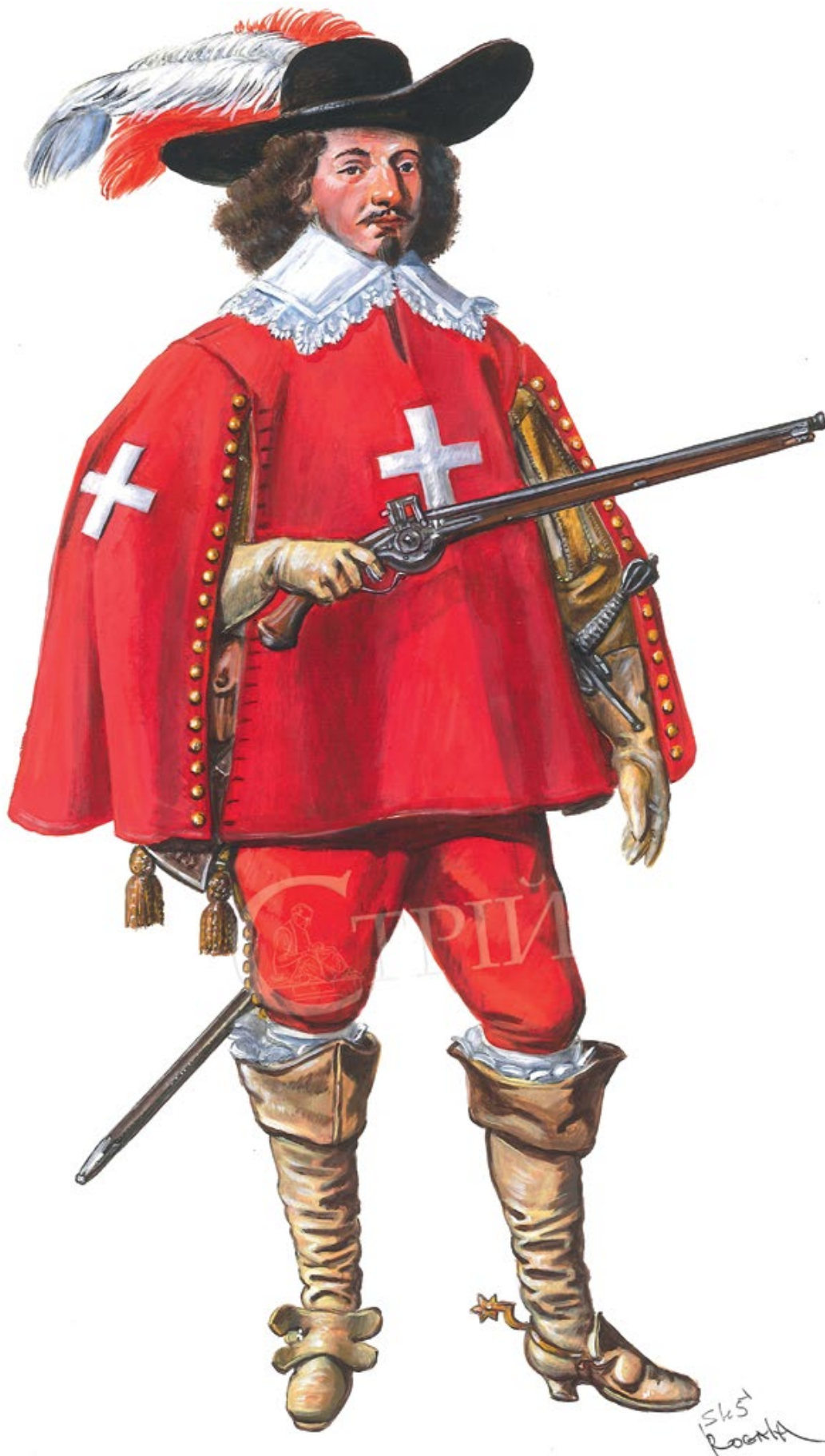
Мал. 3. Художня реконструкція гвардійця Рішельє на чатах біля дверей у покої кардинала (© С. Шаменков).