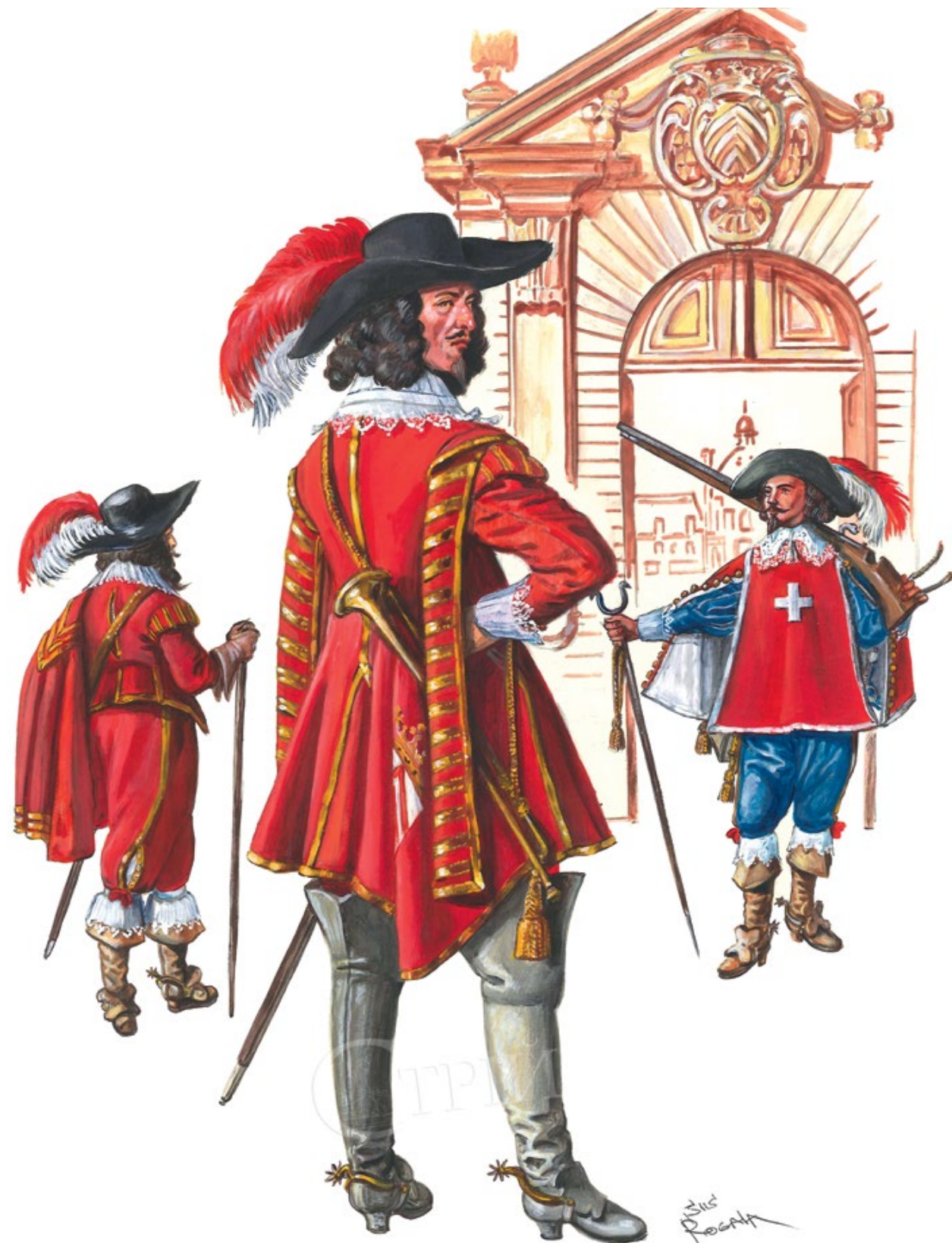
Мал. 4. Художні реконструкції гвардійців перед палацом кардинала де Рішельє (© С. Шаменков). Ліворуч – гвардієць у перерві між вартами прогулюється біля палацу. По центру – сурмач роти кардинала. Праворуч – гвардієць кардинала на чатах перед воротами палацу.