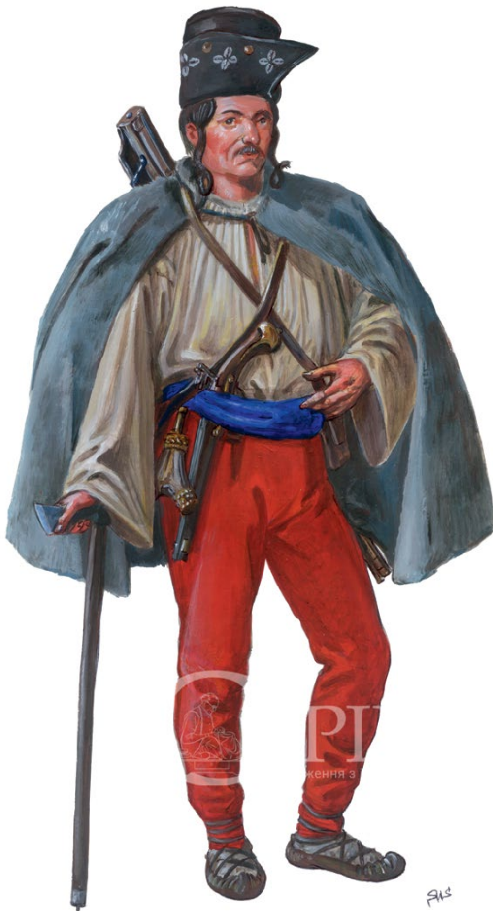
Мал. 6. Спроба художньої реконструкції ватажка опришків (© С. Шаменков).