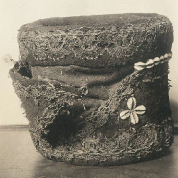
Мал. 4. Шапка словацького збійника Ю. Юношика.

досить широкими полями, прикрашений шнуром та нашитими мушлями каури (Мал. 3, а, в).