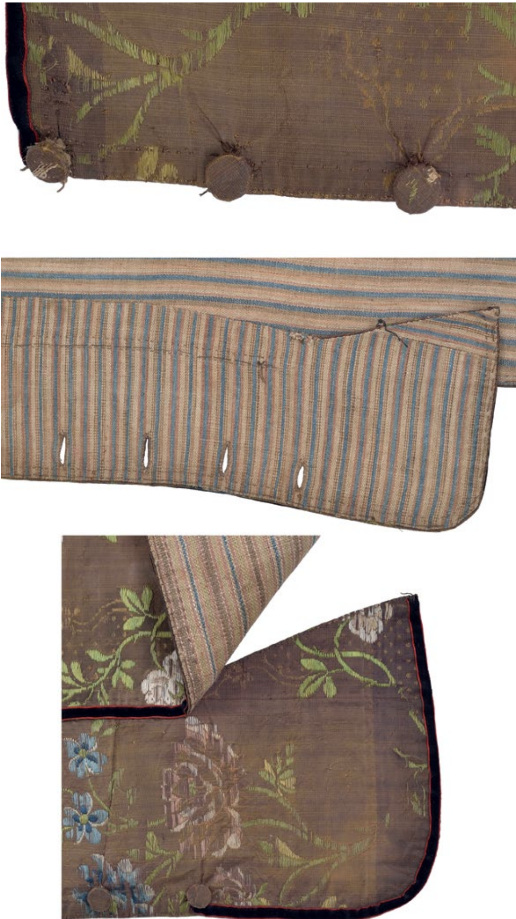
Мал. 8. Спосіб обробки бічних шлиць та Гудзики.