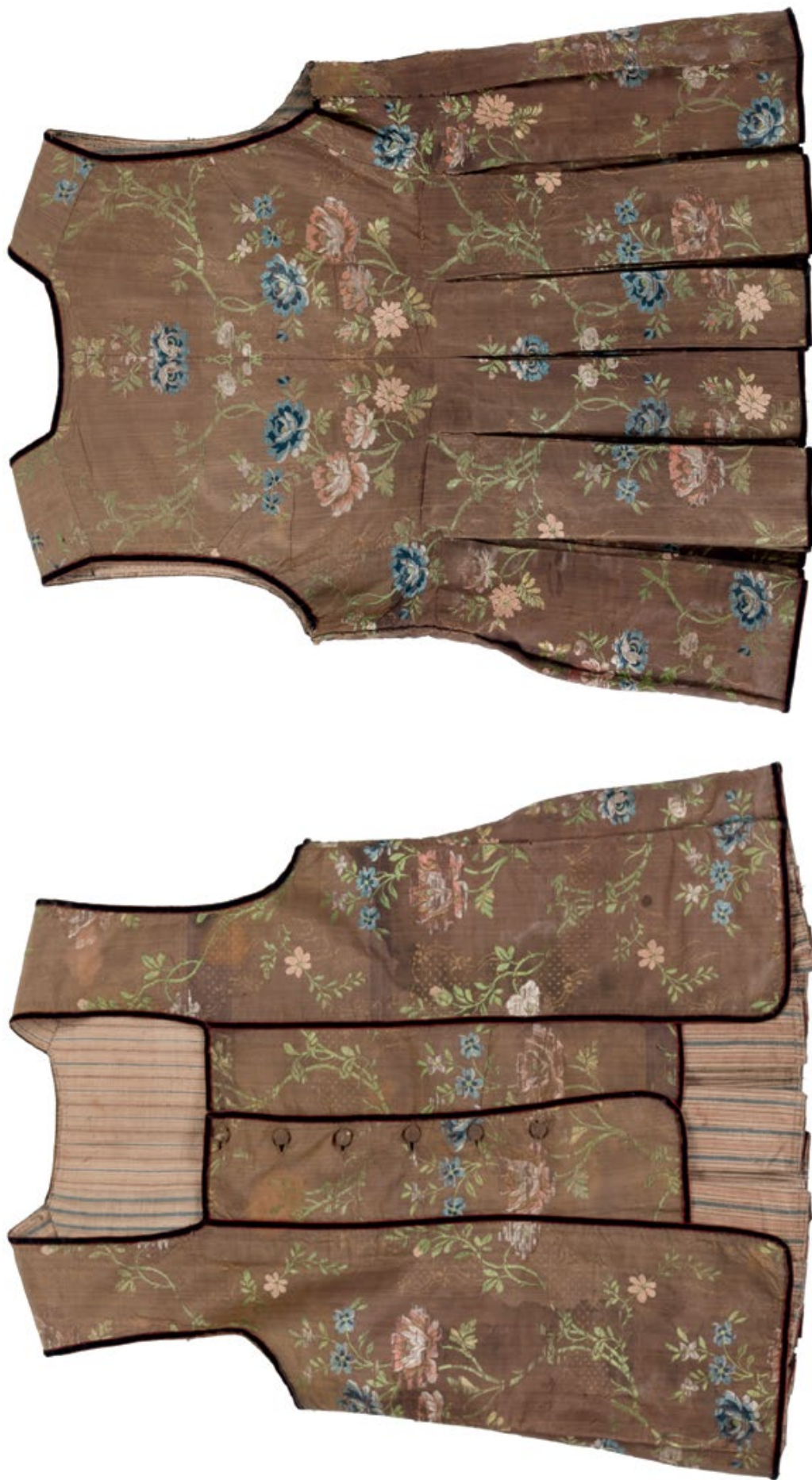
Мал. 5. Загальний вигляд керсетки на на площині.