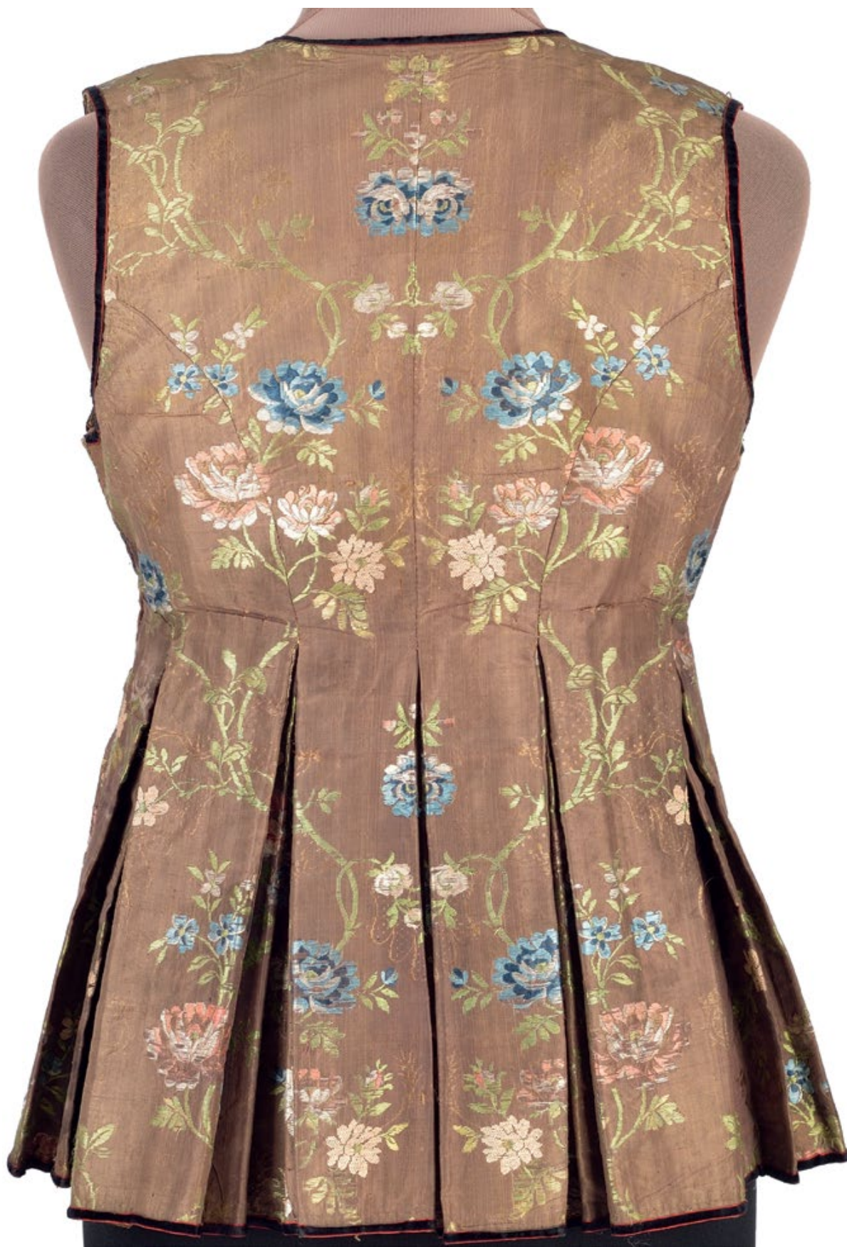
Мал. 3. Загальний вигляд керсетки на манекені.