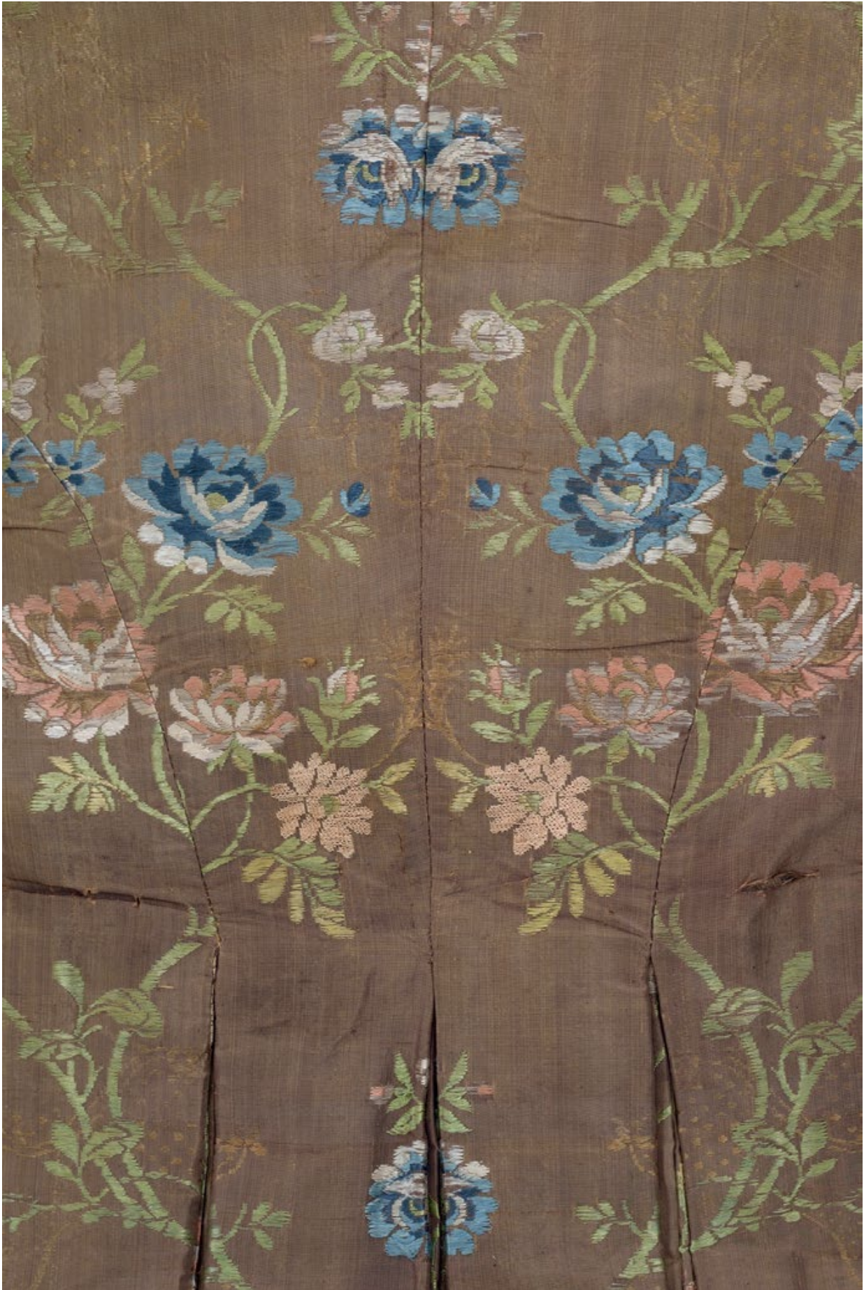
Мал. 10. Фрагмент шовкової тканини верху виробу.