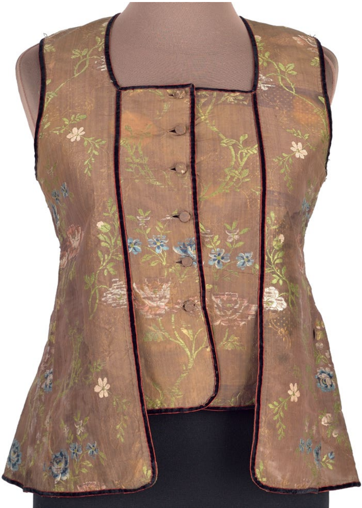
Мал. 2. Загальний вигляд керсетки на манекені.