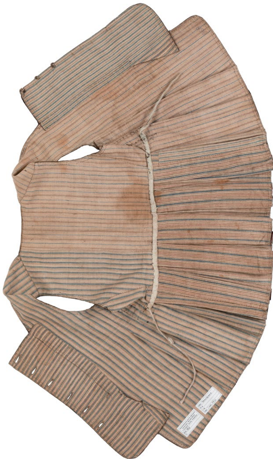
Мал. 7. Керсетка у розгорнутому вигляді, вигляд зісподу Підкладка зшита з лляного полотна, чотирьох різних рапортів смуг.