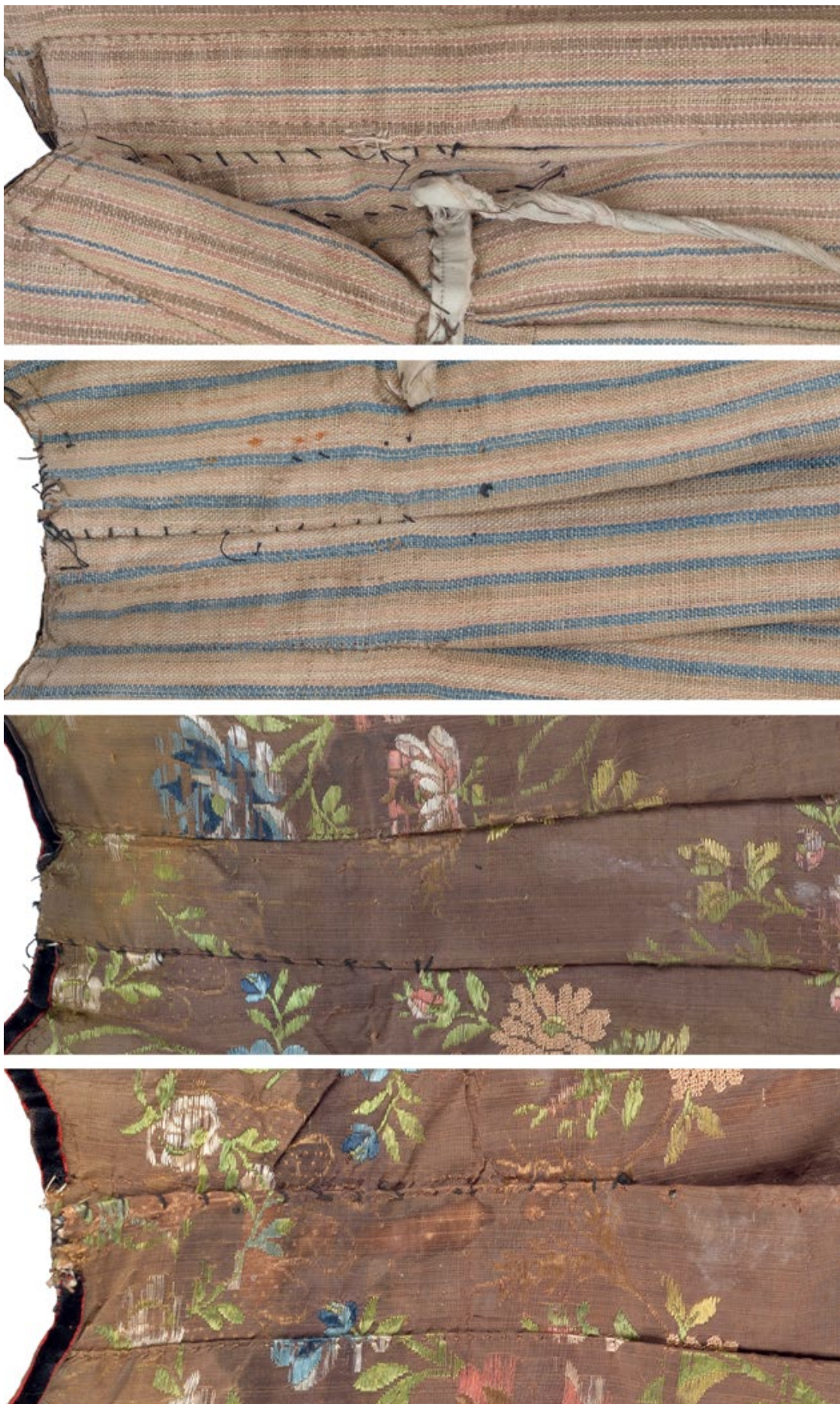
Мал. 9. Місця перешивання виробу у пізніший час. На фото добре видно шви, виконані нитками іншого гатунку.