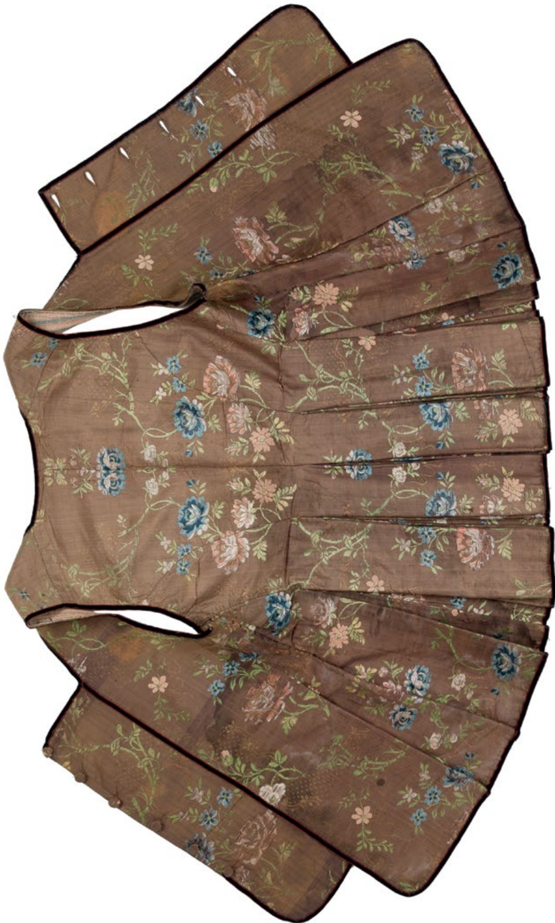
Мал. 6. Керсетка у розгорнутому вигляді, вигляд зверху. Варто відмітити візерунчасту шовкову тканину скроєну з дзеркальним суміщенням малюнку (© О. Мітюхін).