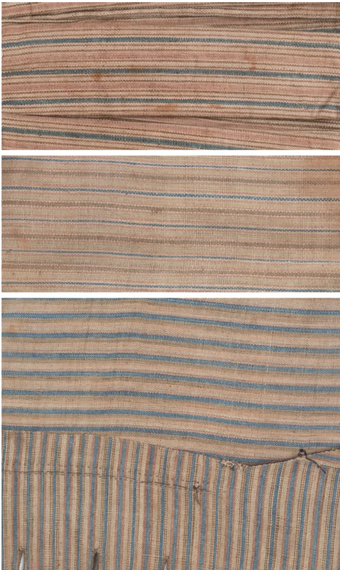
Мал. 11. Фрагменти підкладки зі смугастого льону.