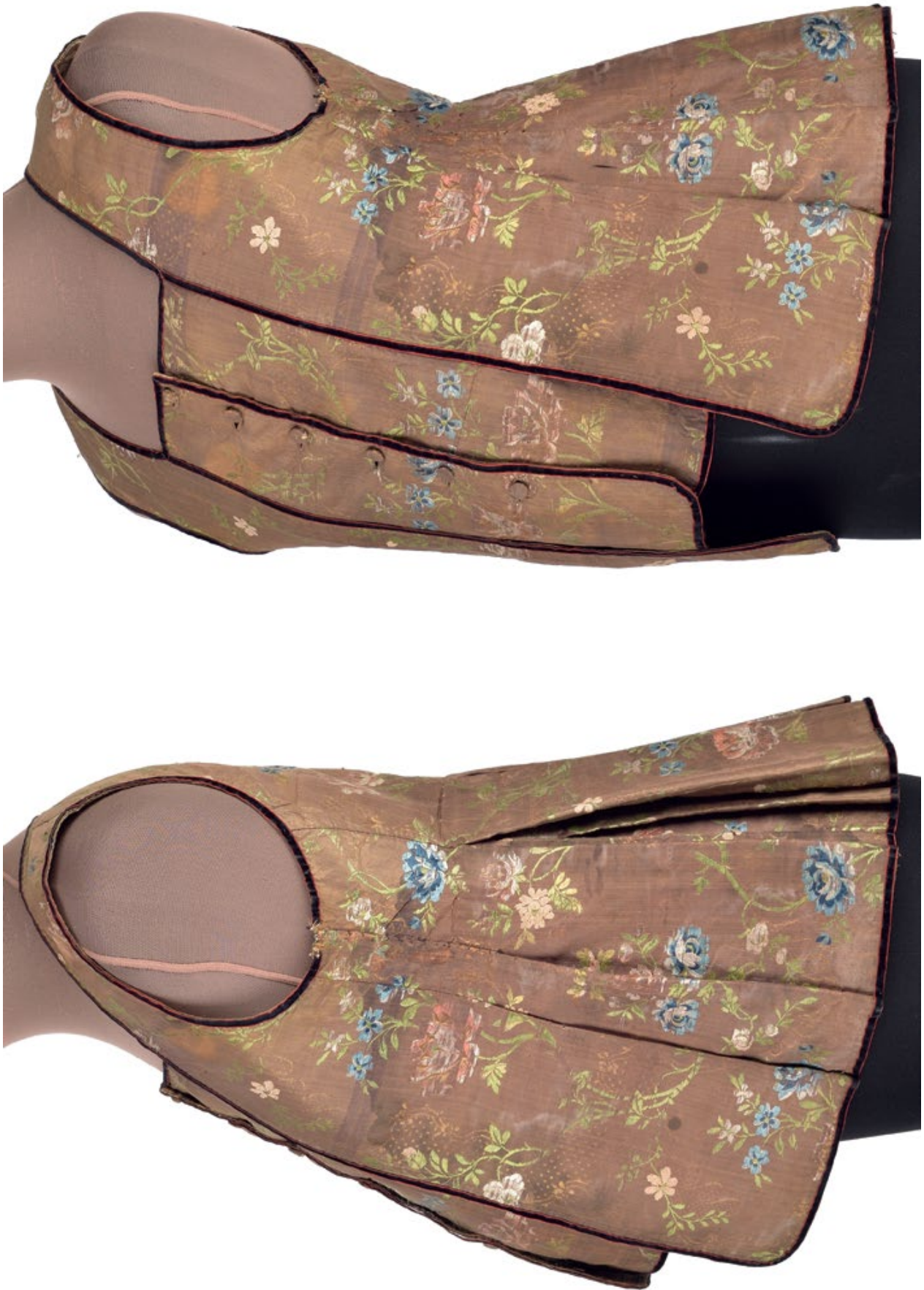
Мал. 4. Загальний вигляд керсетки на манекені.