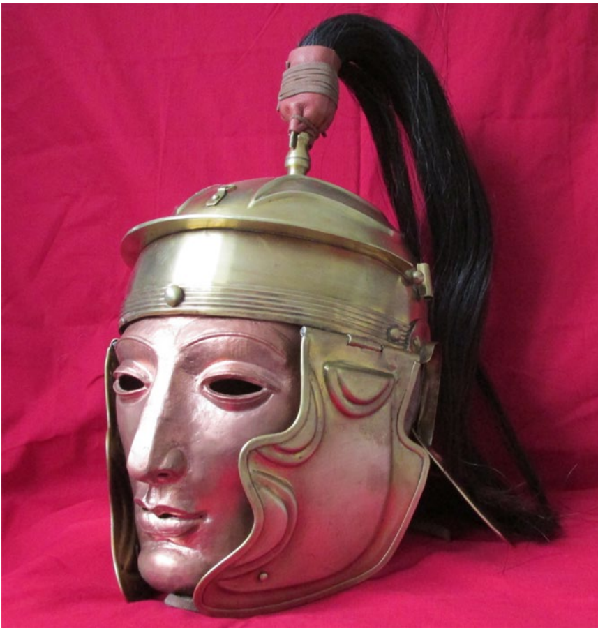
Мал. 8. Шолом з чеканною мідною маскою і кінським хвостом, прикріпленим до навершя.