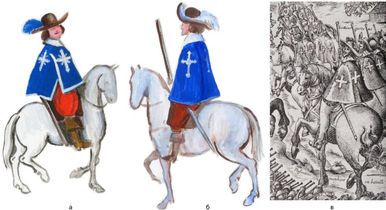
Мал. 3. (а) – Мушкетер з панелі в будинку Рішельє «Siège de La Rochelle» (промальовка автора); (б) – мушкетер з панелі в будинку Рішельє «Réduction de Nîmes, 4 juillet 1629» (промальовка автора); (в) – гравюра Абрахама Босса «Облога Корбі 1636 року».

закінчуються квіткою лілії, полум'я з золота. На всіх плащах « casaque » по краю є велика срібна тасьма. У тексті акцентують увагу на великих хрестах і полум'ї з золота по кутах, але, судячи з зображень, у різні періоди вони бували різних видів. Як бачимо, в описах декору плащів знов відсутній такий елемент декору, як червоні язички полум'я – флами. Флам не видно на картині «Réduction de Nîmes, 4 juillet 1629» (Мал. 3, б) («Réduction de Nîmes»). Вперше флами, вочевидь срібні або білі велюрові, показані на живописній панелі з будинку Рішельє «Siège de La Rochelle» (Мал. 3, а) («Siège de La Rochelle»), яку, вірогідно, виконали на початку 30-х рр. XVII ст. На гравюрі «Облога Корбі 1636 року» авторства, ймовірно, Абрахама Босса (Мал. 2, б) («Map of the siege of Corbie»), у мушкетерів на плащах показано всього по одній хвилястій фламі, яка виходить з чотирьох кутів хреста. Так само по одній фламі показано на іншій гравюрі на тему тієї ж облоги (Мал. 3, в) (Chartrand 18; «Louis XIII (1601-1643)»). На малюнку «tre figure di moschettieri, due in piedi in duello» авторства Стефано делла Беллі, із зібрання галереї Уфіцци (Galleria degli Uffizi), на плащі мушкетера є хрести, але флами знову не показані (Мал. 4, б) («tre figure di moschettieri»).