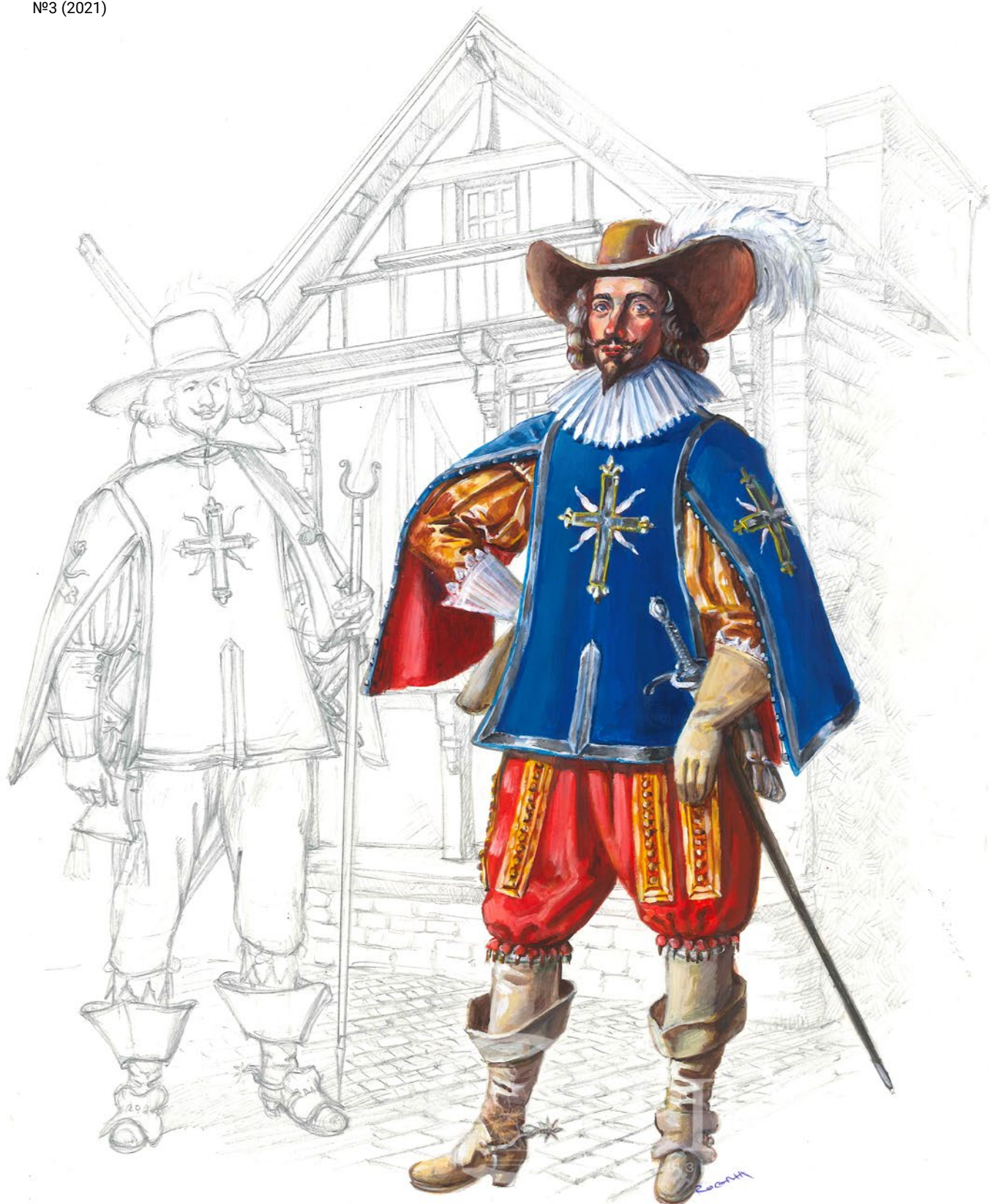
Мал. 6. Мушкетер, 1628-1630-і роки (малюнок автора).