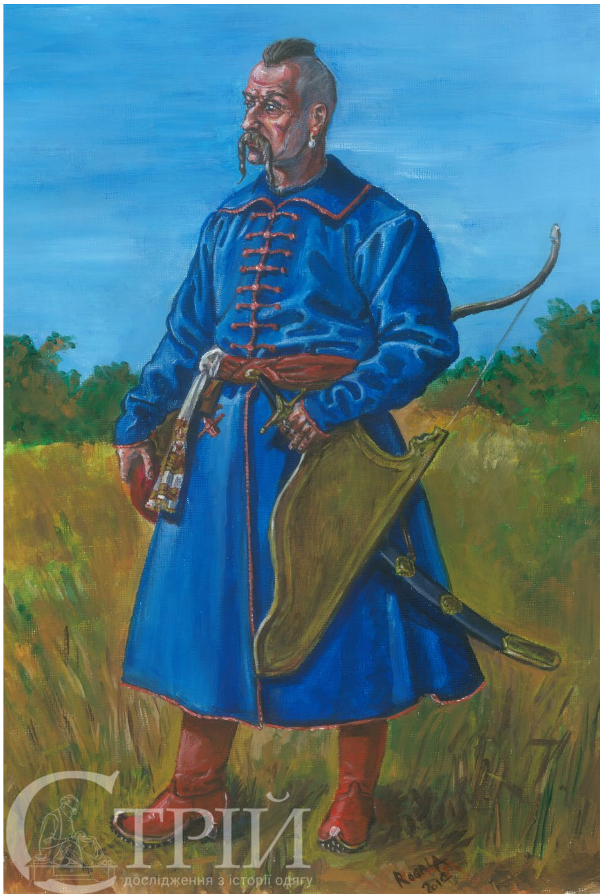
Мал. 8. Іван Підкова, початок 1590-х рр. (малюнок автора).