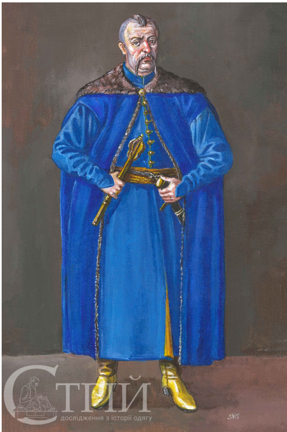
Мал. 9. Запорозький полковник 1610–1630 рр. (малюнок автора).