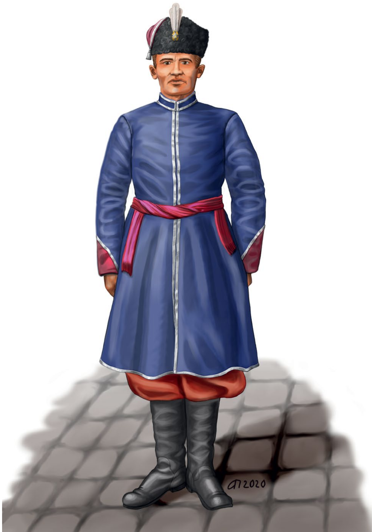
Мал. 13. Козак Армії УНР в парадному однострої, передбаченому наказом Ч.28 від 8 січня 1919 р. Реконструкція за описом у наказі та фотографіями. Малюнок А. Папакіна.