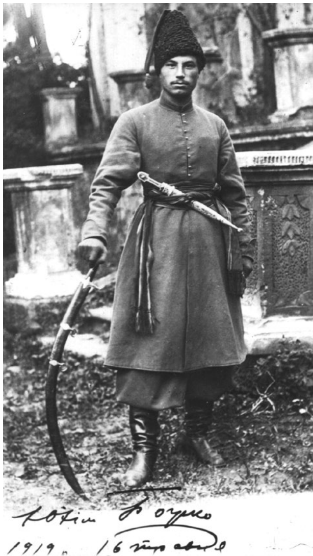
Мал. 9. Отаман «Запорізької Січі» Ю. Божко. 1919 р.

Отаман одягнений у жупан оригінального крою, підперезаний кушаком, широкі шаровари, на голові носить чорну каракулеву шапка зі шликом. Ще одним «козацьким» елементом його спорядження є старовинна шабля.