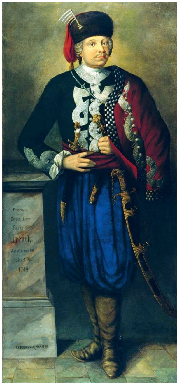
Мал. 8. Ф. фон дер Тренк пензля Ф. Файльгаммера. 1880 р.

Можна помітити цікавий парадокс: в той час як козаки «Запорізької Січі», ймовірно, в тому числі завдяки зовнішньому вигляду, з почуттям вищості дивилися на «регулярщину», армійські старшини виражають не менше презирство до «запорожців» через їх «пістрявий», «оперетковий» вигляд, спричинений носінням псевдокозацького одягу.