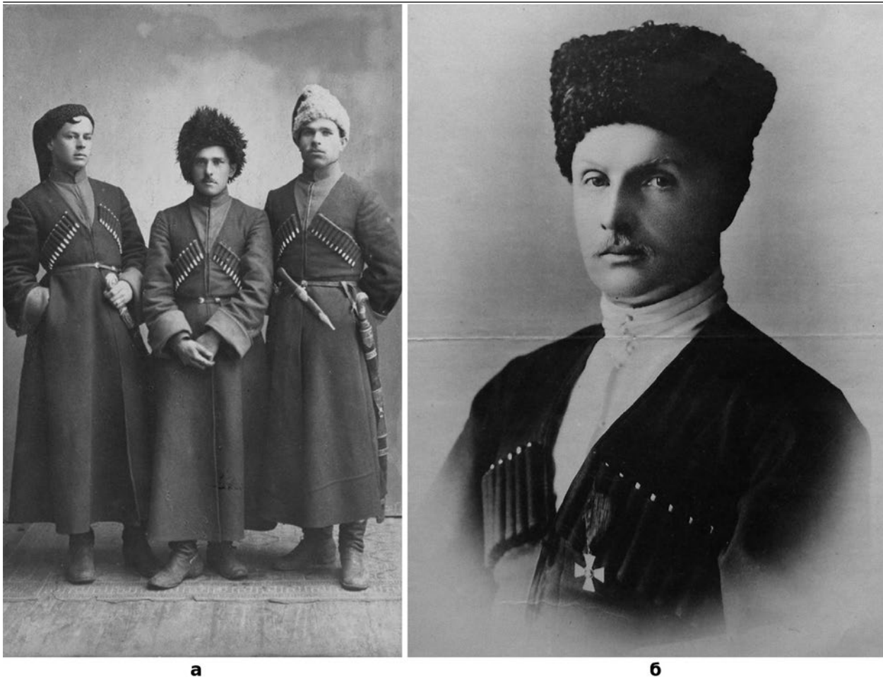
Мал. 5. (а) – Старшини куреня ім. Я. Кармалюка. 1918 р. (б) – Павло Скоропадський у черкесці. 1918 р. ЦДАВО України.

черкески в якості зимового одягу були пошиті напередодні протигетьманського повстання для Окремої Запорізької дивізії, тому «зимою вся дивізія мала вигляд кубанських козаків, а літом – бельгійської армії» (Авраменко 249, 258); у черкески були одягнені в листопаді 1918 р. кінні козаки чоти під командуванням Петра Дяченка, майбутні «Чорні Запорожці» (Дяченко 28). В черкесці ходив і позував до численних фотографій і сам гетьман України Павло Скоропадський (Мал. 5, б). Водночас, черкески досить широко використовували і в «білогвардійських» військових формуваннях та в Червоній армії, в т.ч. на території України.