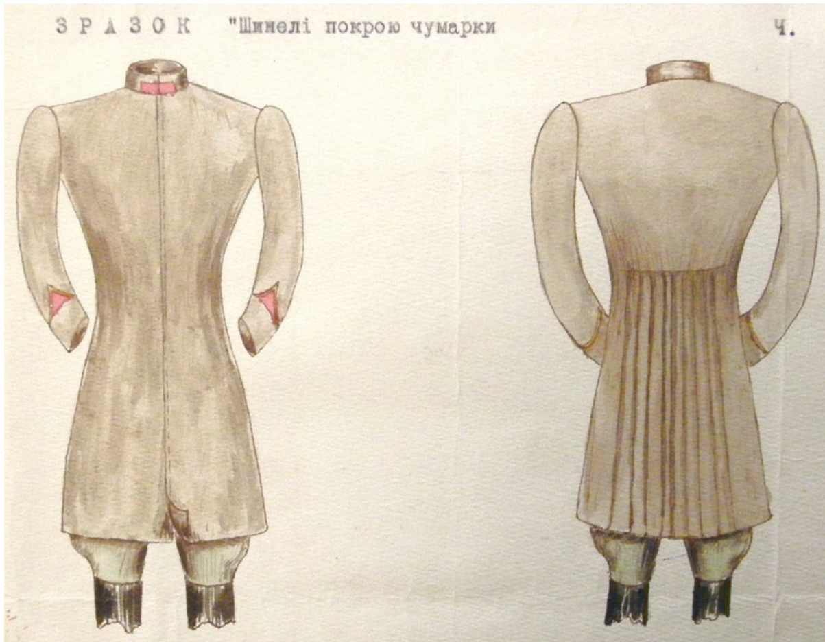
Мал. 15. Зразок шинелі покрою чумарки. Малюнок до наказу від 24 квітня 1919 р. ЦДАВО України.