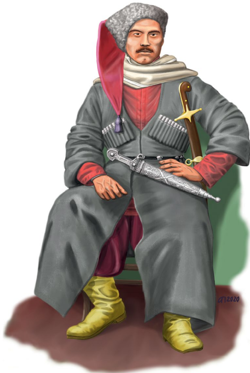
Мал. 10. Отаман Ю. Божко. 1919 р. Зовнішній вигляд відтворено на підставі словесного опису М. Аркаса. Малюнок А. Папакіна.