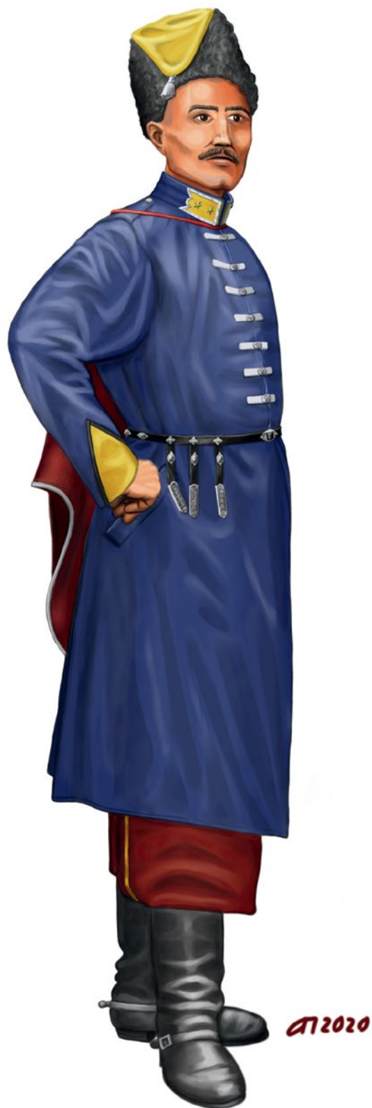
Мал. 17. Гуртковий 1-го Лубенського Максима Залізняка полку. Однострій за проектом кінця листопада 1921 р. Реконструкція за описом у наказі. Малюнок А. Папакіна.