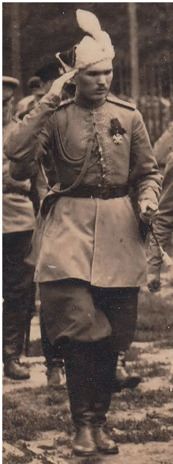
Мал. 12. Старшина Лубенського Сердюцького кінно-козацького полку. 1918 р.