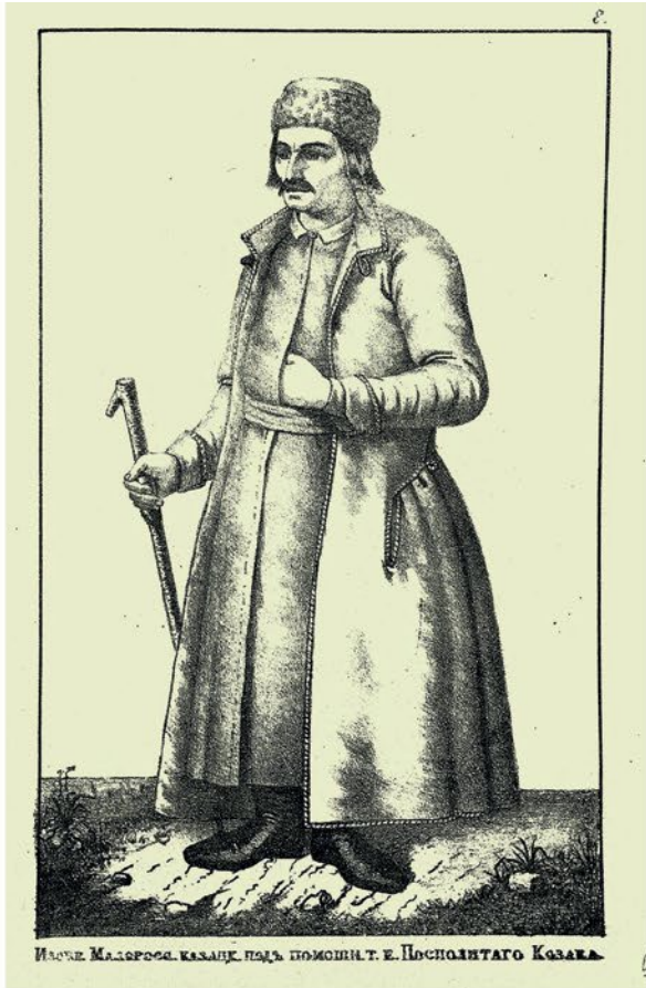
Молоде Малороссе, казани, подъ помощнъ г. Писаренятаго Козака.