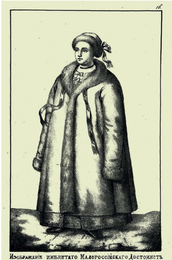
Изображеніє имъицитаго Малороссійскаго Достоянствъ.