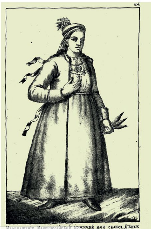
ИЗОБРАЖЕНІЕ Малороссійской МУЖИЧЕЙ или СЕЛЬСКО ДѢВКИ