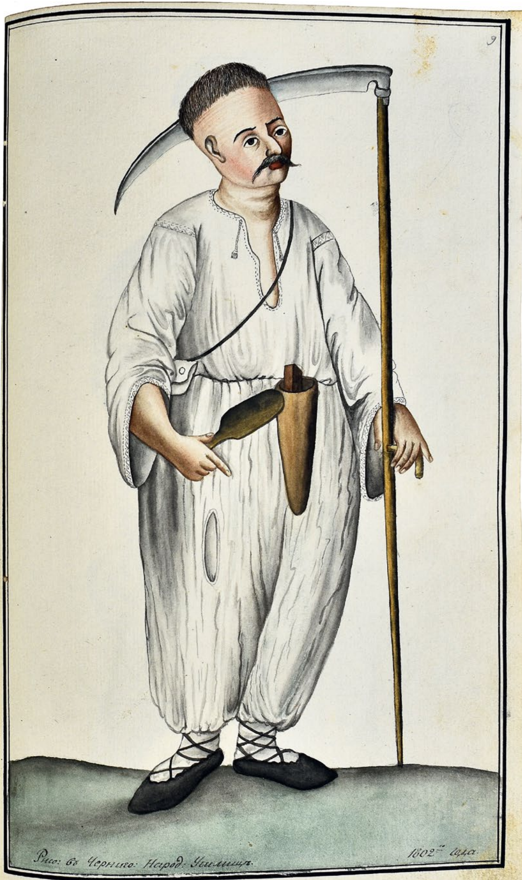
Рис. в Чернигов. Народ. Чимлиця.