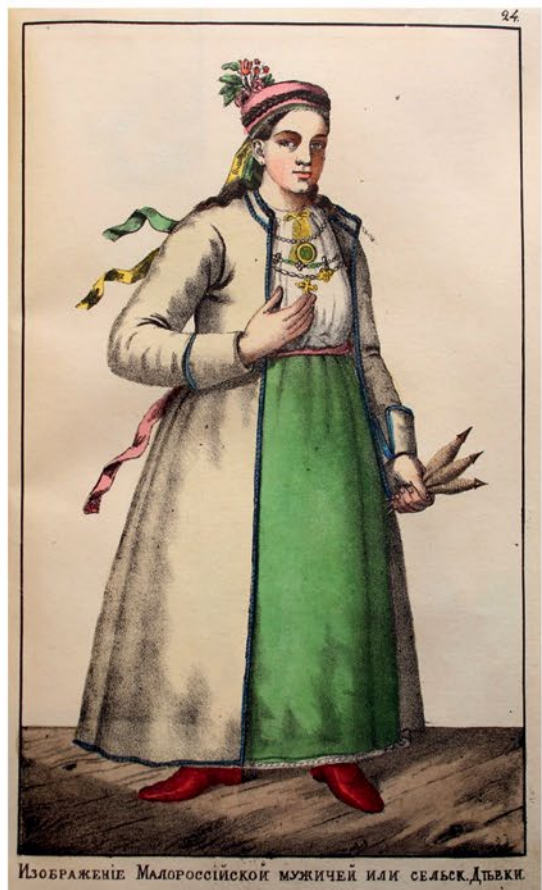
ИЗОБРАЖЕНІЕ Малороссійской МУЖИЧЕЙ или СЕЛЬСКО ДѢВКИ