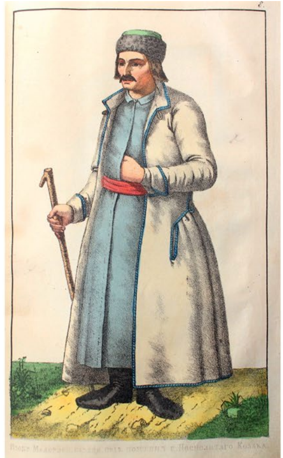
Молоде Малороссе, казани, подъ помощнъ г. Писаренятаго Козака.