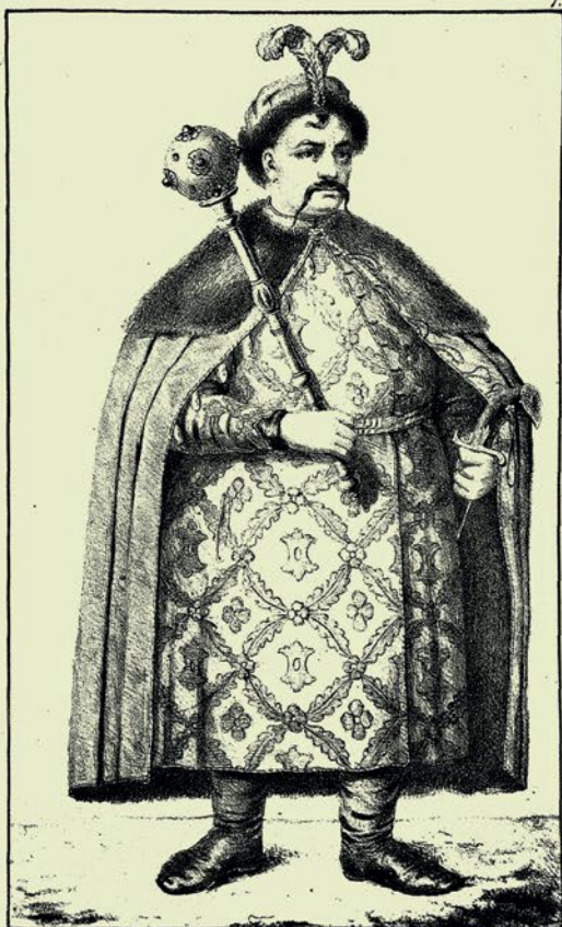
Изображеніе войска Запорожскаго и обонухъ сторонъ гвмы Днѣпра Гетмана.