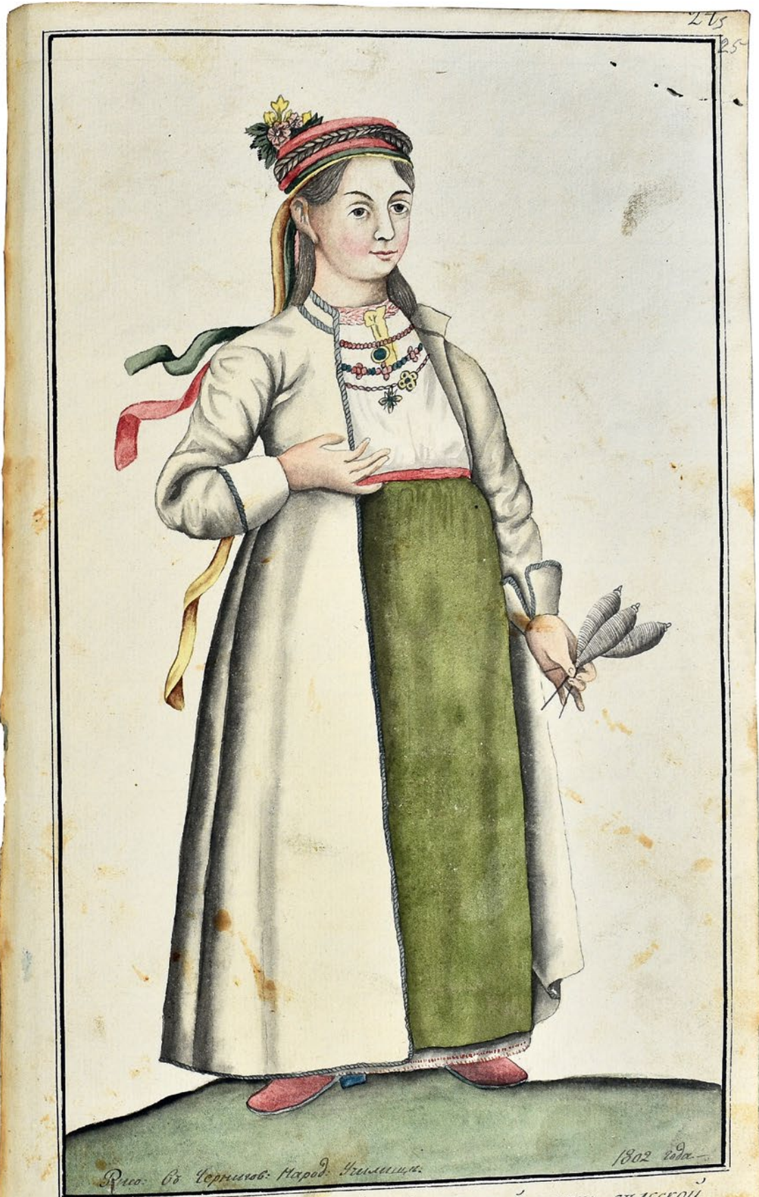
Рис. въ Чернилов. Народ. Института. 1802 год. Изображение Малороссійской простой дѣвки слѣвской въ свѣтъ.