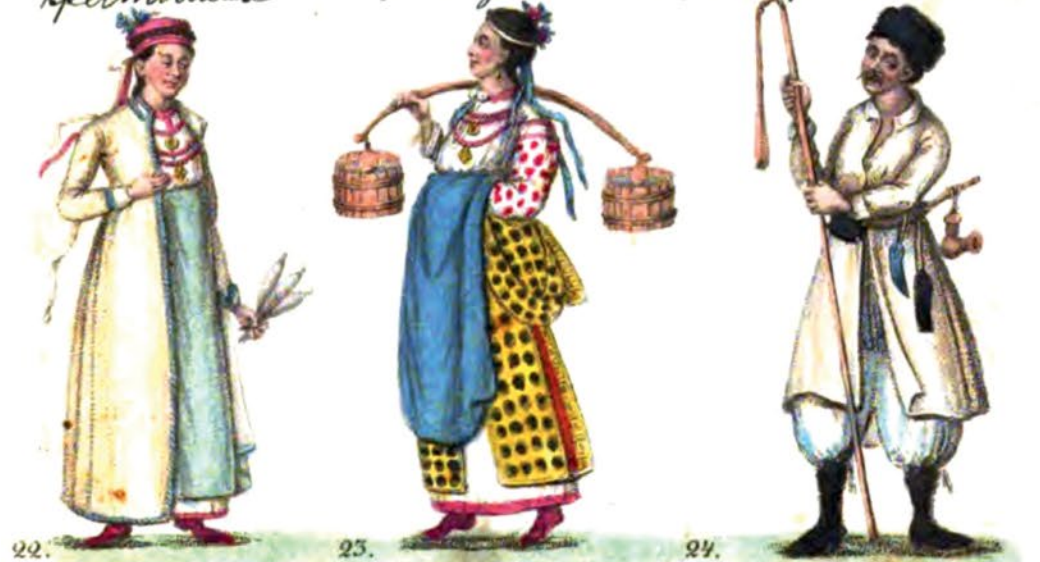
22. Сивелая дубча 23. Монах 24. Литовская