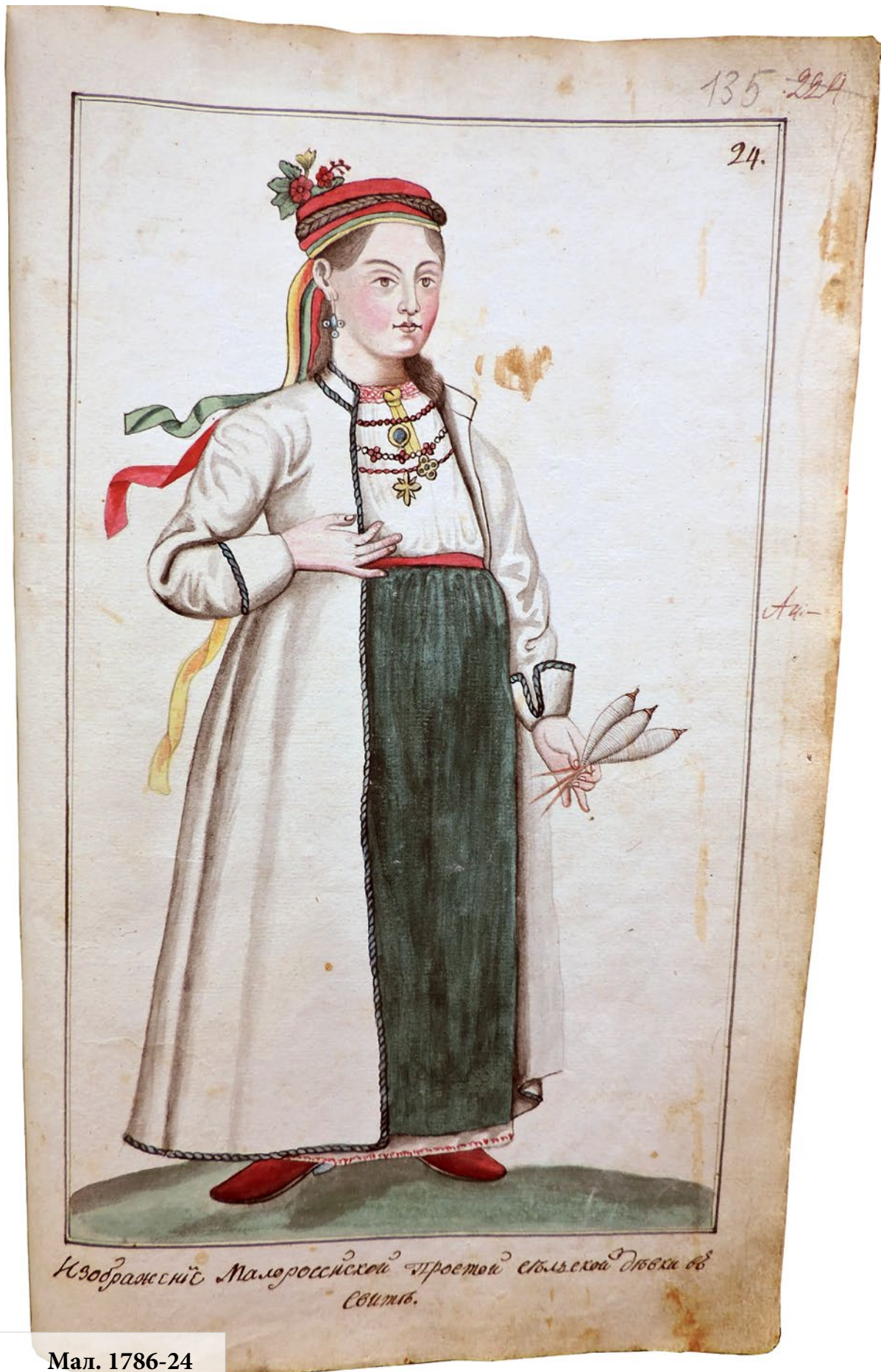
Изобразеніє Малороссійской чуроной сельской Дювки въ свитѣ.