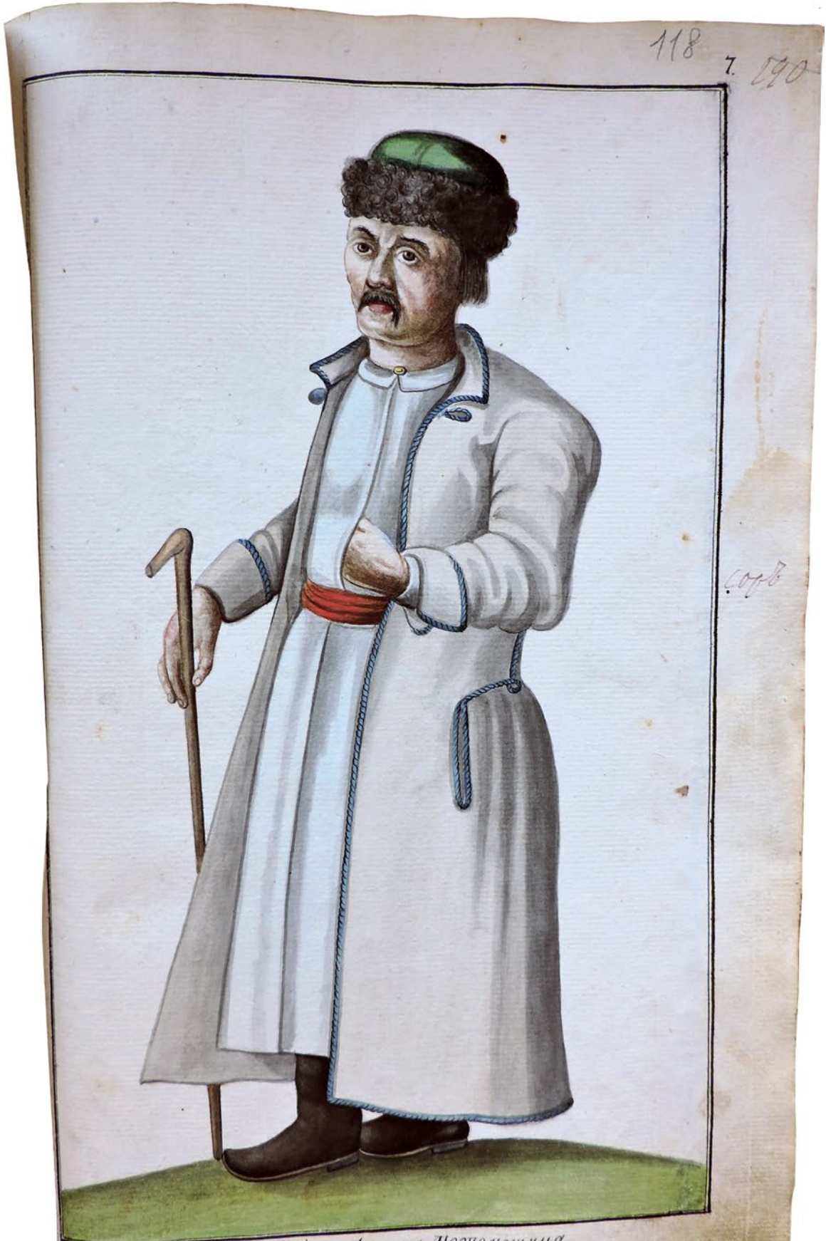
Изображеніе малороссійскаго Козака Подполцка.