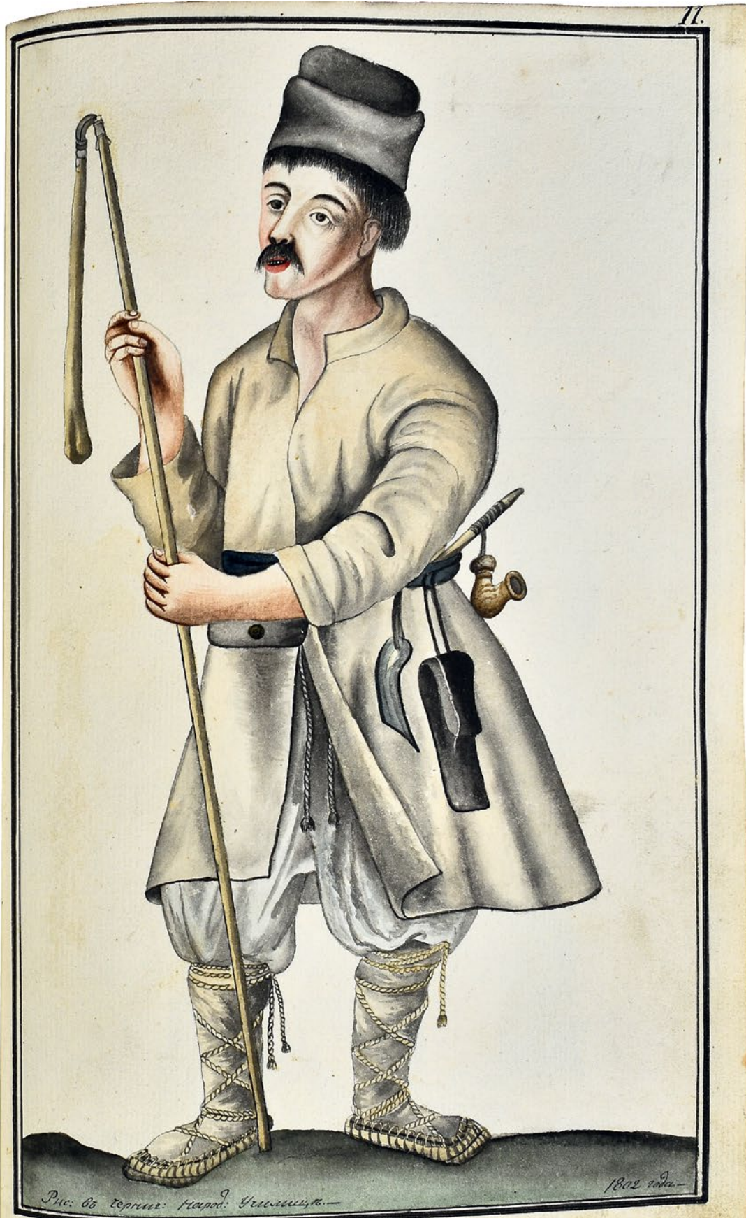
Изображение Литовскаго мужина.