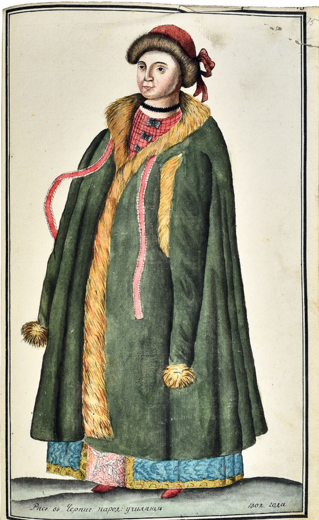
Изображение шляхетной Малороссійской Гостажы 66 зимней нарядъ.