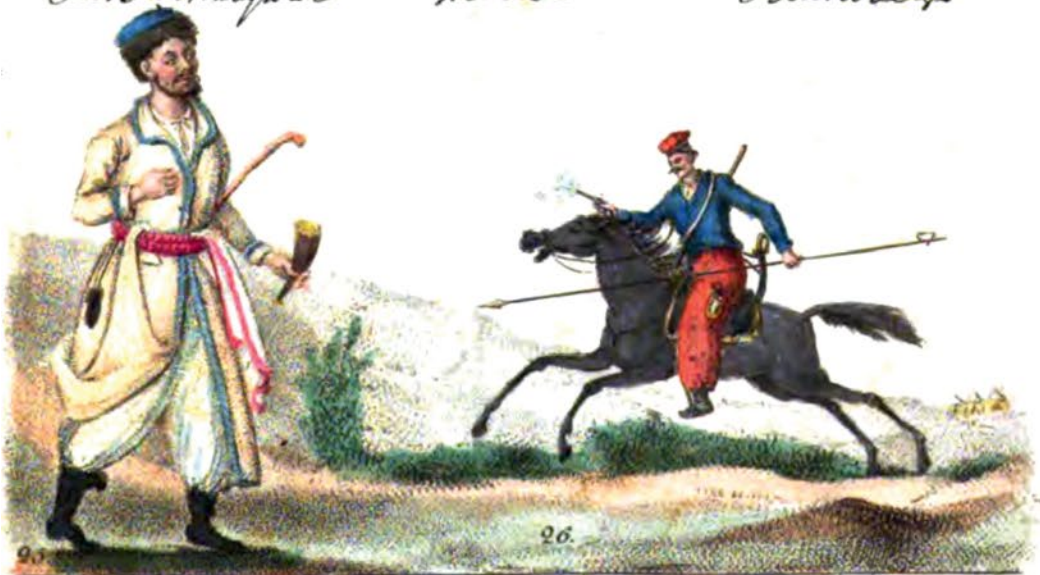
25. Монах 26. Запорожская