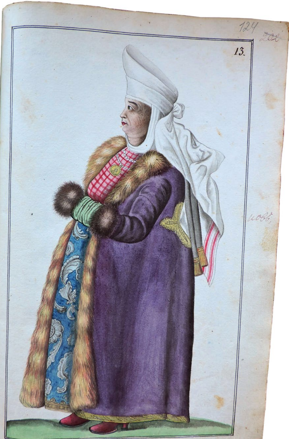
Изображеніо Малороссійской стариннойъ Госпожи.