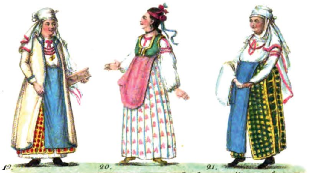
19. Крестбица 20. Шыцаина дубча 21. Крестбица