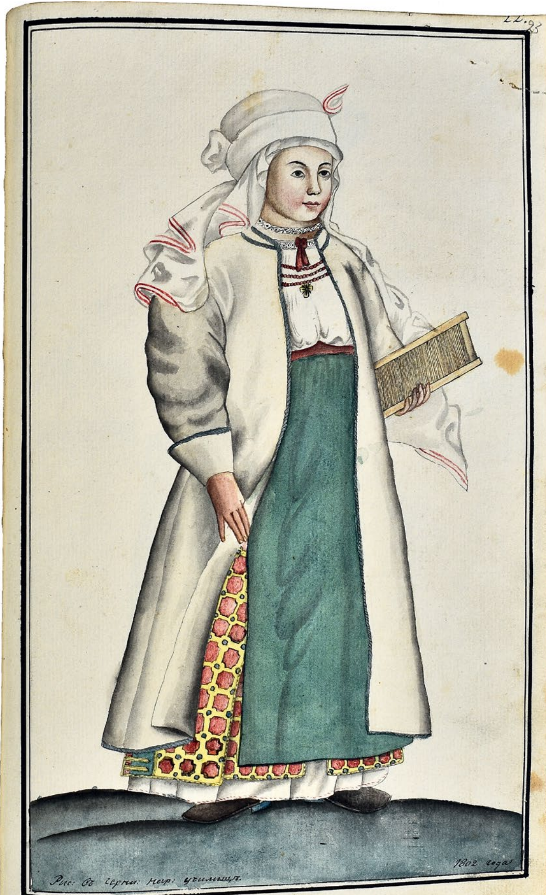
Мал. 1802-22 Изображеніе Малороссійской женщины въ селѣ. —