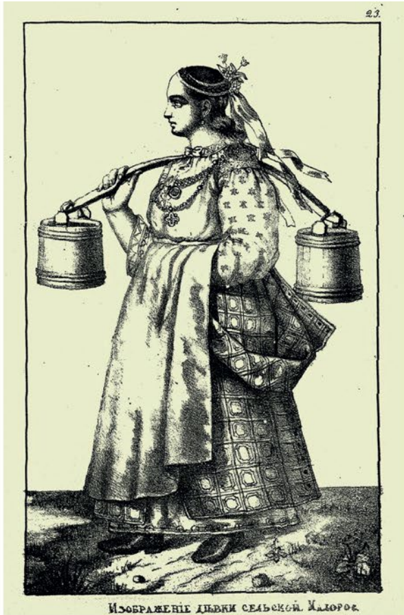
ИЗОБРАЖЕНІЕ ДѢВКИ СЕЛЬСКОЙ Малорос.