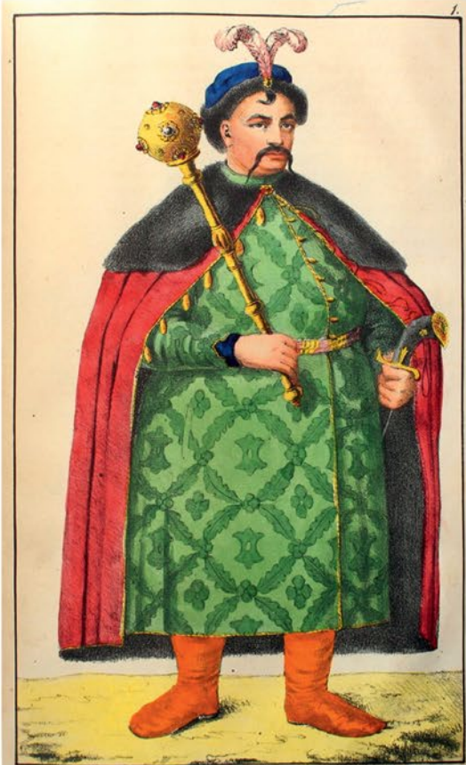
Изображеніе войска Запорожскаго и обонухъ сторонъ рѣки Днѣпра Гетмана.