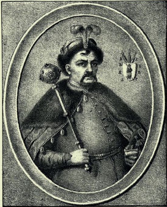
Богданъ Хмельницкій, войска священнаго Царскаго величества Запорожскаго Гетманъ.