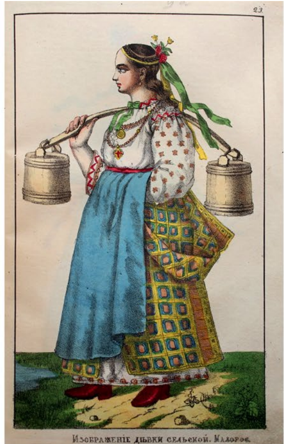
ИЗОБРАЖЕНІЕ ДѢВКИ СЕЛЬСКОЙ Малорос.