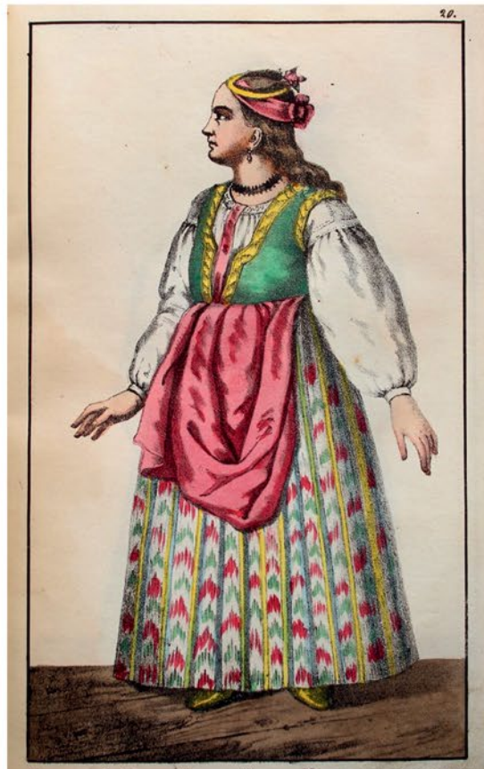
Изображеніе Дѣвки Малороссійскаго Мещанскаго достойнствѣ.