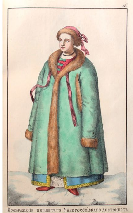
Изображеніє имъицитаго Малороссійскаго Достоянствъ.