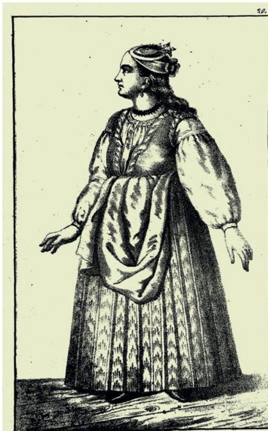
Изображеніе Дѣвки Малороссійскаго Мещанскаго достойнствѣ.