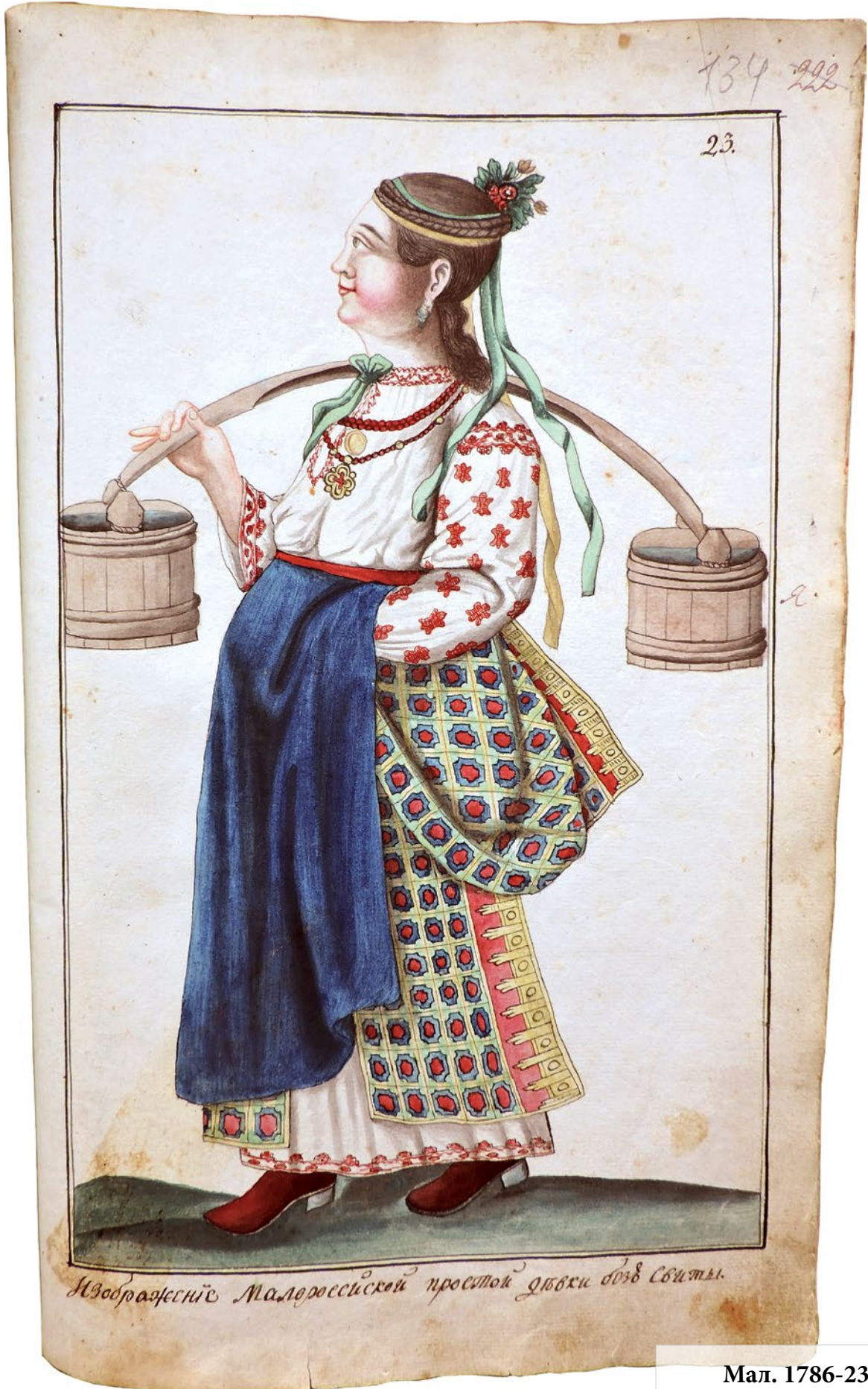
Изображение Малороссийской простой дворянки дождь святи.