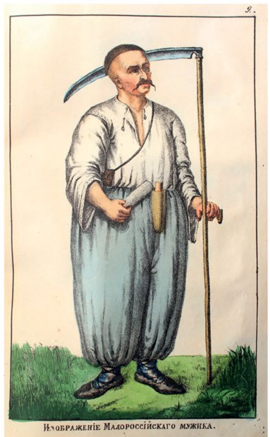
Изображеніе Малороссійскаго мужика.