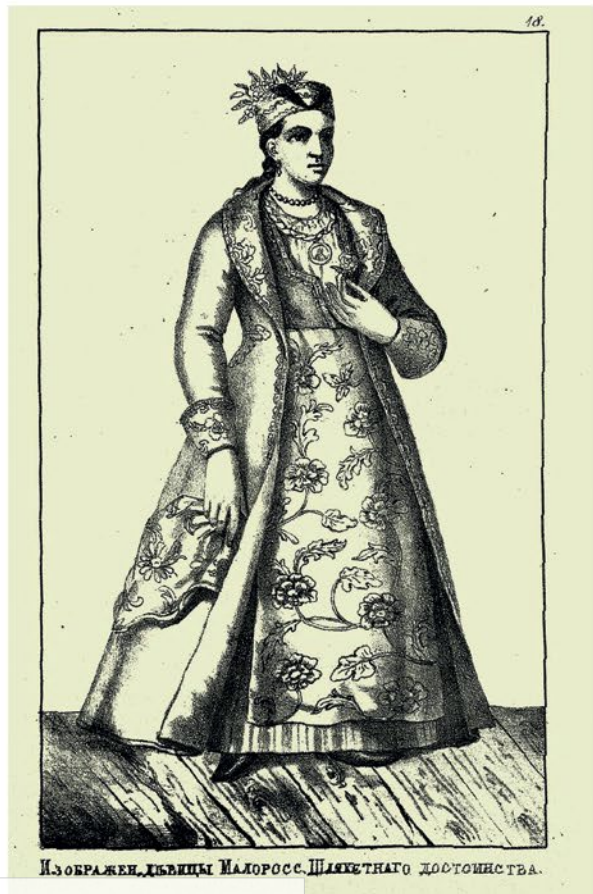
Изображенъ дъвицы Малоросс. Шляхетнаго Достоянства.