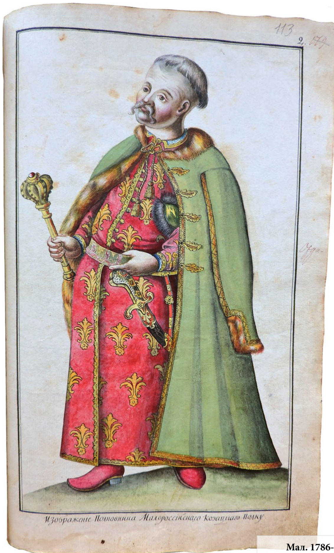
Изображеніе Полковника Малороссійскаго Козацкаго Полку.