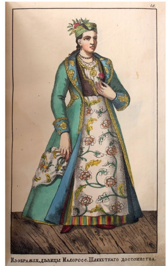
Изображенъ дъвицы Малоросс. Шляхетнаго Достоянства.