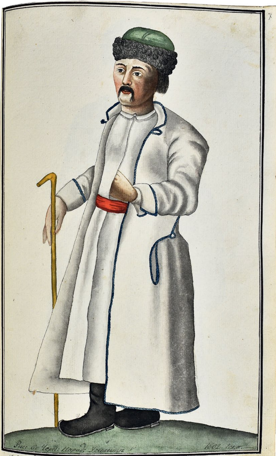
Изображение Малороссийскаго казака Пестрополицкаго.