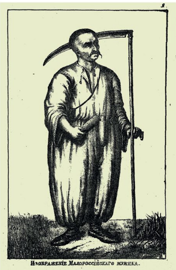
Изображеніе Малороссійскаго мужика.