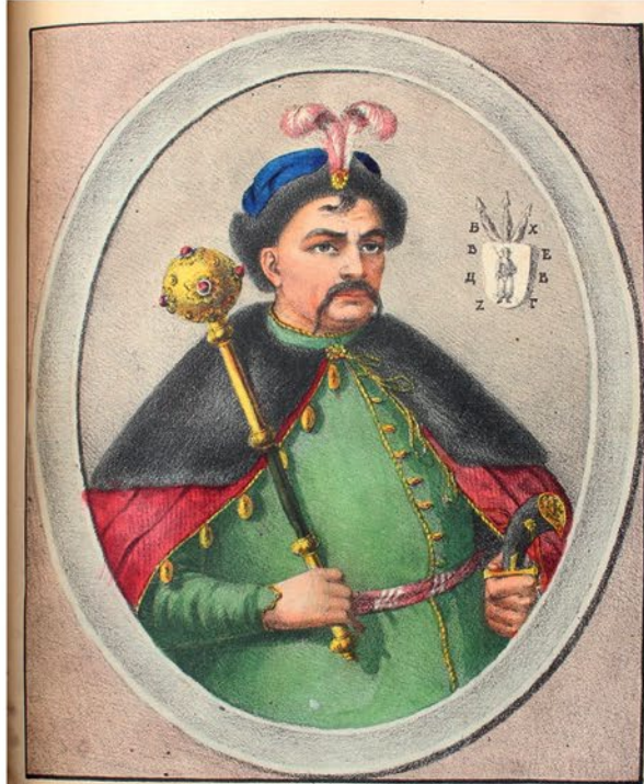
Богданъ Хмельницкій, войска священнаго Царскаго величества Запорожскаго Гетманъ.