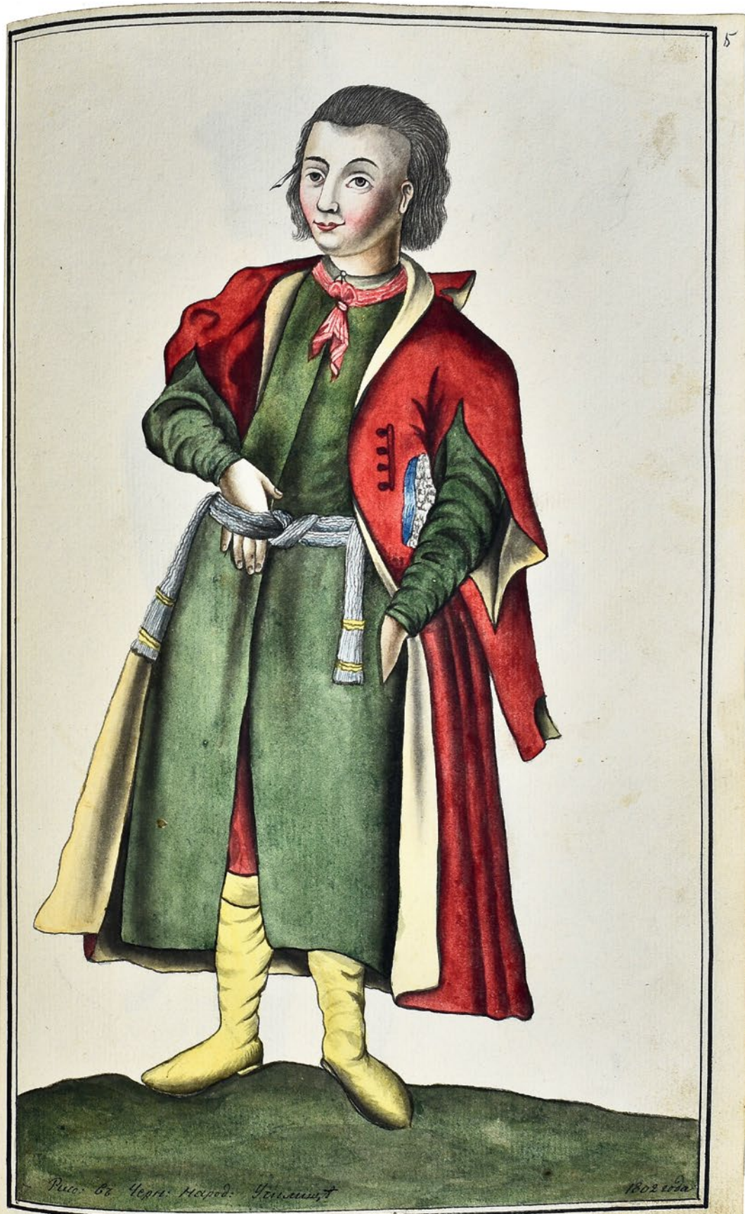
Изображеніе Малороссійскаго Канцеляриста.