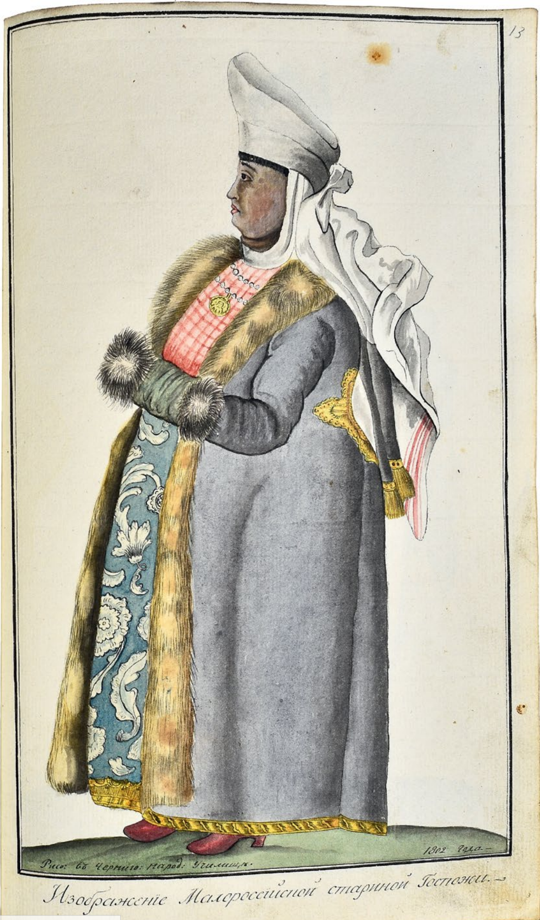
Рис. въ Черниг. народ. Училищ.