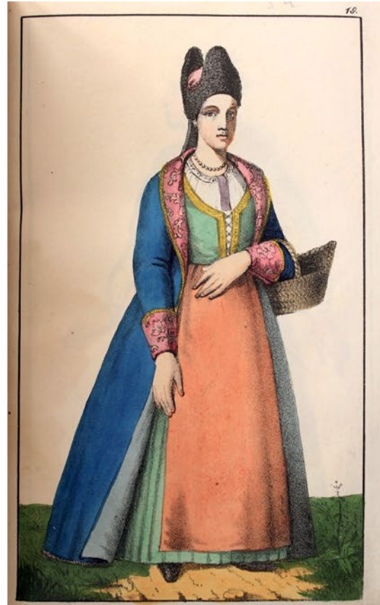
Изображеніе Малороссійской Мещанки.