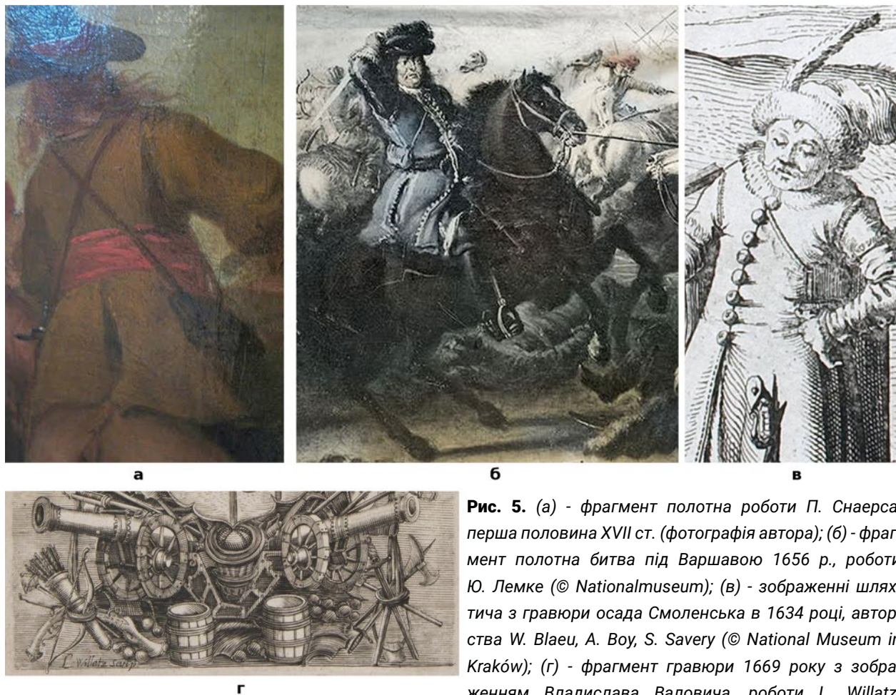
Рис. 5. (а) - фрагмент полотна роботи П. Снаерса, перша половина XVII ст. (фотографія автора); (б) - фрагмент полотна битва під Варшавою 1656 р., роботи Ю. Лемке (© Nationalmuseum); (в) - зображення шляхтича з гравюри осада Смоленська в 1634 році, авторства W. Blaeu, A. Voy, S. Savery (© National Museum in Kraków); (г) - фрагмент гравюри 1669 року з зображенням Владислава Валовича, роботи L. Willatz.

шкіри та не є паяними металевими, а висвердлені в суцільному масиві дерев'яного прямокутника. Такому прямокутнику надавали вигнутої форми, отвори в ньому могли розміщуватися як в один, так і в два ряди, а сама лядунка покривалася шкірою. В деяких випадках кришка лядунки прибивалася одразу з тильного боку до дерев'яної частини. На відміну від попередніх зразків, де кришка закривала лядунку до половини, тепер кришки повністю покривали передній бік лядунки. Кришки таких ладівниць могли містити чеканну або гравіровану металеву бляху. В деяких лядунках набої прикривала не одна, а кілька кришок: перша з тонкої шкіри прикривала набої, друга була шкіряною з металевою декорованою бляхою, третя – з тонкої шкіри, що в свою чергу зберігала декоровану бляху від пошкоджень. Такого типу лядунка зберігається в Музеї-Арсеналі, відділі Львівського історичного музею (Рис. 6, а).