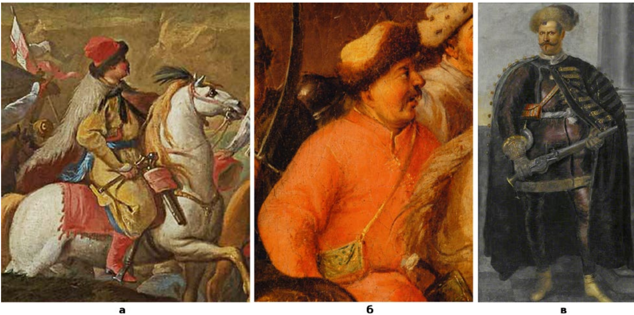
Рис. 4. (а) - шляхтич з полотна Альтамонте, що зображує елекцію короля Августа Сильного 1696 р.; (б) - фрагмент полотна, що зображує битву під Хотиним 1674 року; (в) - портрет легкого кавалериста, приблизно 1630-ті роки XVII ст.

лядунку він носить через праве плече (Рис. 5, в) 23 . На портреті легкого кавалериста 1630-х рр. невідомого майстра добре видно невелику, криту тканиною лядунку (Рис. 4, в) 24 . Зрідка лядунки розміщували серед предметів «арматури» навколо портретів, так, як це зробив на гравюрі 1669 р. з зображенням Владислава Валовича художник L. Willatz (Рис. 5, г) 25 . Кілька зображень, датованих серединою XVII ст., нам відомо за скульптурними рельєфами, на яких представлено два різних варіанти лядівниць. На рельєфі 1640-х рр. «Шляхтич та Смерть» з костьола в м. Тарлові показана невелика прямокутна лядунка зі шкіряним покриттям червоного кольору та фігурно вирізаною кришкою (Рис. 3, б). Добре видно спосіб кріплення до лядунки, вочевидь, шкіряного паска. Лядівниця трапецієподібної форми зображена на рельєфі з костьола міста Пелплін в Польщі (Рис. 3, в) 26 . За зображеннями видно, що шкіряна кришка лядівниці могла бути не тільки трикутної форми,