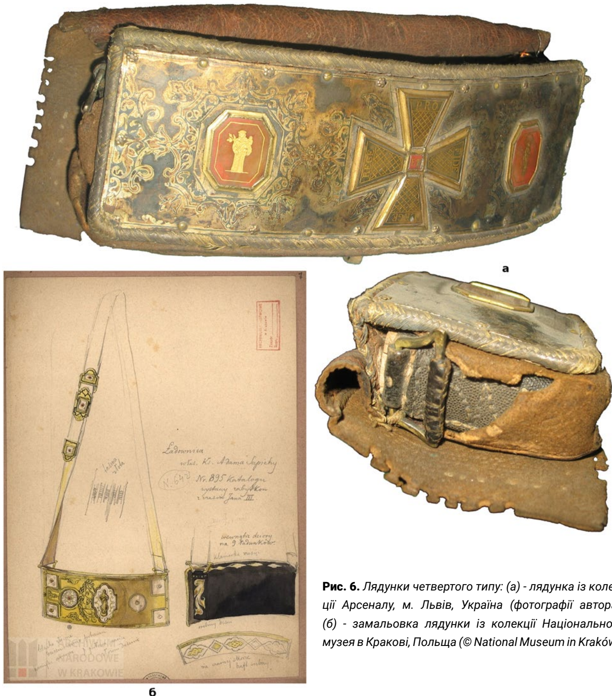
Рис. 6. Лядунки четвертого типу: (а) - лядунка із колекції Арсеналу, м. Львів, Україна; (б) - замальовка лядунки із колекції Національного музею в Кракові, Польща.

кавалерійські лядівниці з дерев'яними вставками з висвердленими отворами на 10 та більше набоїв відсутні. Так само і лядунки з металевими пластинами на кришці, що містили орнаменти, герби, кавалерські хрести, судячи зі збережених артефактів та зображень епохи, з'явилися наприкінці XVII – на початку XVIII ст. Зокрема,