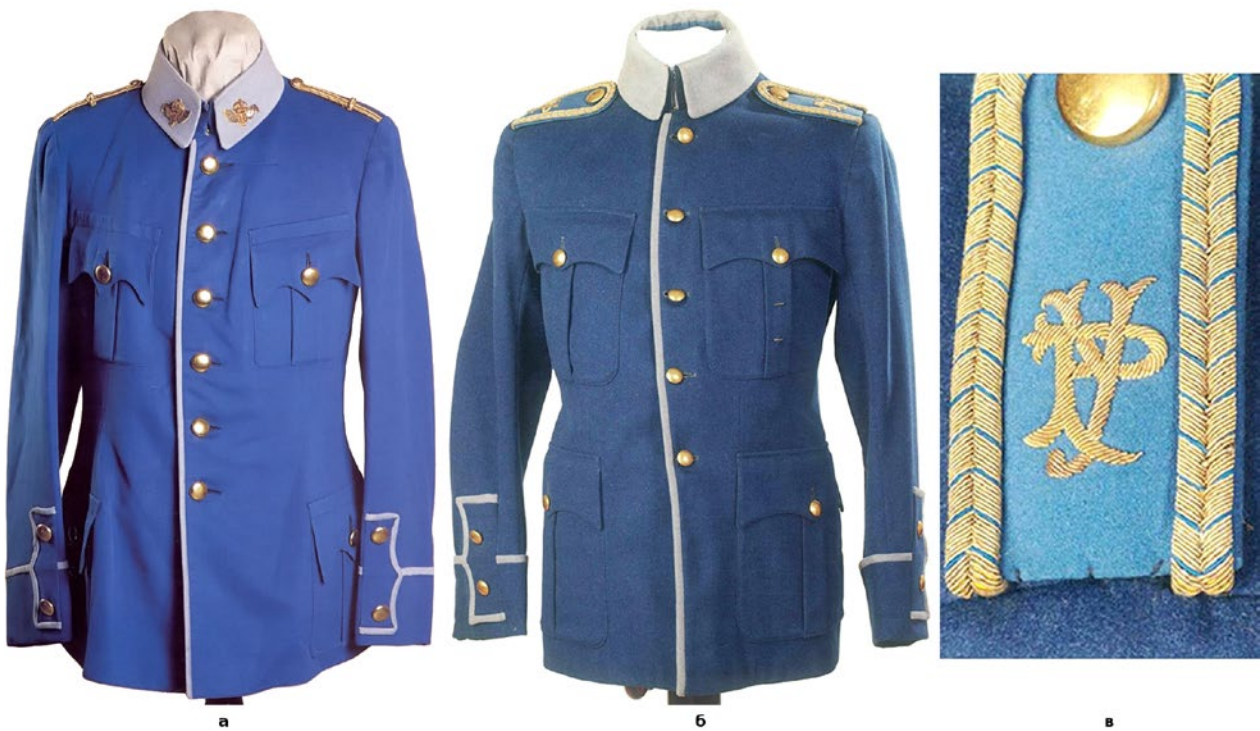
Рис. 2. (а) – Кітель від обмундирування Австрійського добровольчого автомобільного корпусу; (б) – кітель від обмундирування Перехідної станиці у Відні. Військово-історичний музей, м. Відень; (в) – погон з кітеля від обмундирування Перехідної станиці у Відні. Військово-історичний музей, м. Відень.