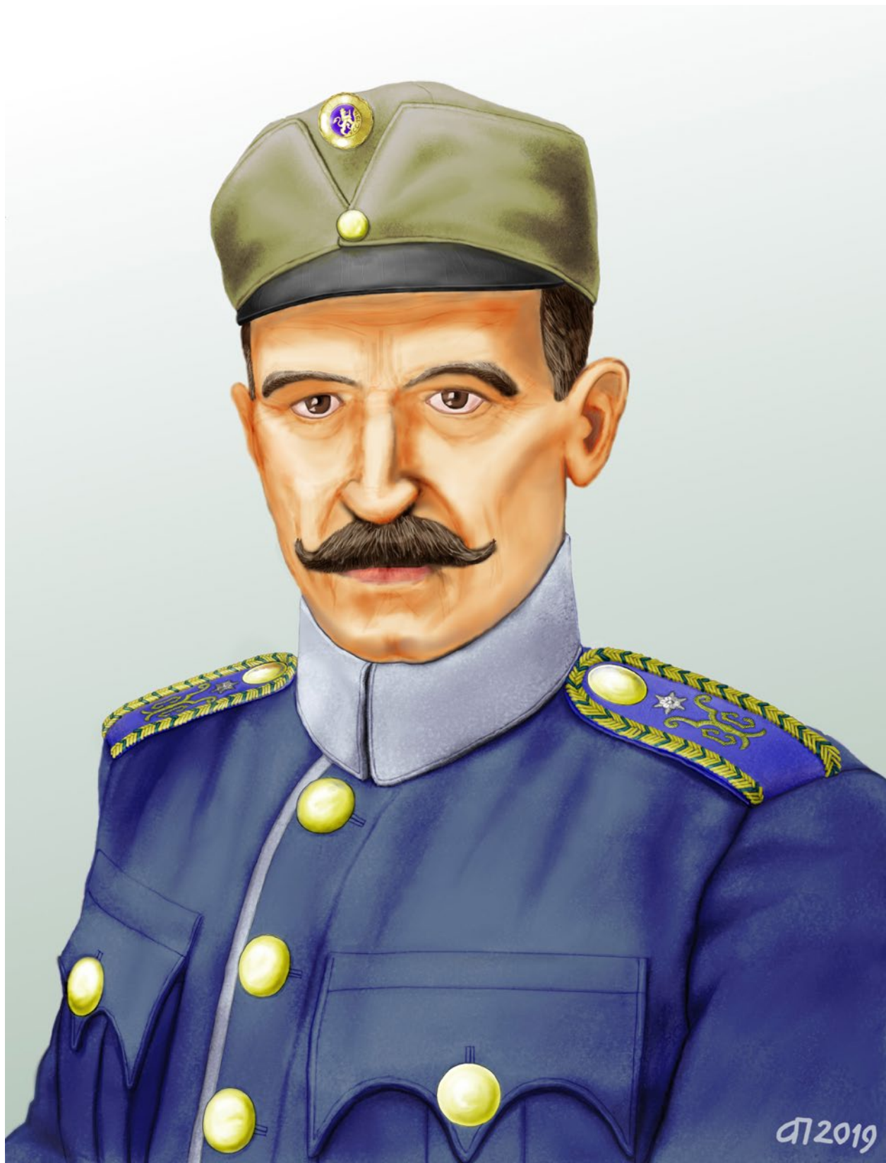
Рис. 5. Поручник запасної сотні УСС у Відні. 1918–1919 р. (малюнок А. Папакіна).