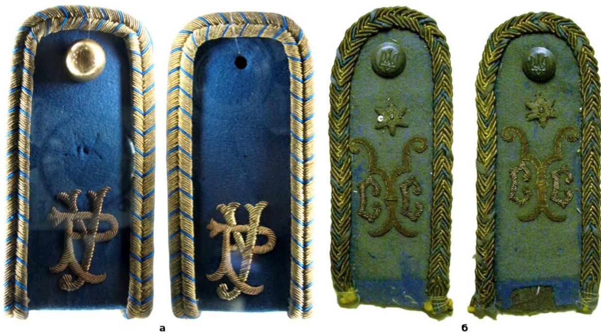
Рис. 3. (а) – Погони від обмундирування Перехідної станиці у Відні. Музей Війська Польського, м. Варшава (фото автора, 2018 р.); (б) – погони поручника (?) Перехідної станиці у Відні. Гудзик з тризубом доданий, ймовірно, вже на еміграції. ЦДАВО України (фото автора, 2012 р.).